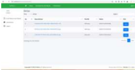
Gambar 18 Halaman Lihat Berkas Notaris