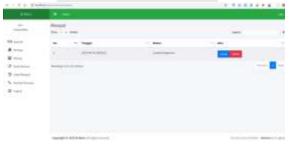
Gambar 14 Halaman Lihat Riwayat

terdapat menu lihat riwayat setelah melakukan login yang dimana masyarakat dapat melihat riwayat kapan dia membuat warisan. Pada fitur ini juga masyarakat dapat melihat apakah surat yang ia sudah ajukan sudah di approve atau tidak.