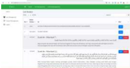
Gambar 20 Halaman Content Management Admin

Pada halaman ini terdapat halaman content management admin yang dimana admin dapat menambah, memperbaharui, dan menghapus konten-konten yang ada pada aplikasi.