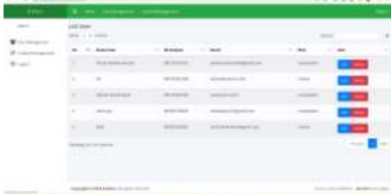
Gambar 19 Halaman User Management

tampilan User Management pada admin yang dimana pada halaman ini admin dapat melihat pengguna-pengguna yang mendaftarkan akun mereka. Pada halaman ini admin dapat menambah, memperbaharui, dan menghapus pengguna dari aplikasi ini.