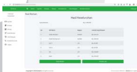
Gambar 12 Hasil Perhitungan

Tahap selanjutnya setelah masyarakat mengisi data keluarga pewaris yang ditinggalkan, maka masyarakat akan diperlihatkan hasil dari perhitungan dan pembagian harta warisan tersebut.