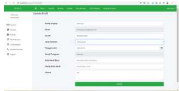
Gambar 15 Halaman Ubah profil

fitur ubah profil yang dimana masyarakat bisa menggunakannya untuk mengubah data diri mereka apabila ada terjadi kesalahan.