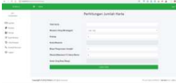
Gambar 6 Hitung 1

untuk menghitung harta warisan. Masyarakat akan diminta untuk mengisi semua total harta yang ingin dibagi. Apabila telah berhasil maka sistem akan lanjut ke tahap kedua perhitungan.