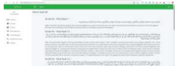
Gambar 4 Halaman Syariah Masyarakat

tampilan syariah setelah melakukan login sebagai masyarakat yang digunakan untuk melihat surah-surah yang berkaitan tentang pembagian dan perhitungan harta warisan.