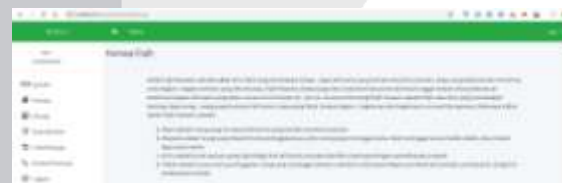
Gambar 5 Halaman Konsep Masyarakat

terdapat menu Konsep kepada masyarakat setelah melakukan login . Pada menu ini jika pengguna ingin melihat konsep yang dipakai untuk membagi dan menghitung harta warisan.