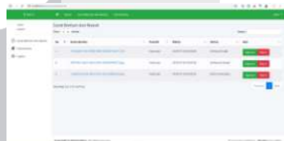
Gambar 17 Halaman Surat Warisan dan Wasiat

tampilan dari fitur surat warisan dan wasiat setelah melakukan login sebagai notaris yang dimana fungsinya dapat melihat surat warisan yang telah masyarakat ajukan. Pada tahap ini juga notaris dapat menyetujui surat warisan yang diajukan masyarakat atau menolak surat tersebut dan mengembalikannya kembali kemasyarakat dengan memberi catatan kesalahan pada surat warisan.