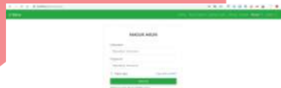
Gambar 3 Halaman Masuk Akun

Pada tampilan login masyarakat yang digunakan untuk masuk kedalam halaman utama aplikasi. Apabila login berhasil, maka akan masuk kedalam tampilan menu utama. Apabila login tidak berhasil maka akan ada pengulangan login. Di dalam tampilan login terdapat pilihan tombol yaitu "Masuk" yang digunakan untuk masuk ke dalam halaman utama aplikasi.