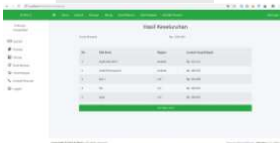
Gambar 8 Halaman Hasil Hitung

Berikut merupakan tampilan hasil dari perhitungan dan pembagian harta warisan yang telah dilakukan ditahap sebelumnya.