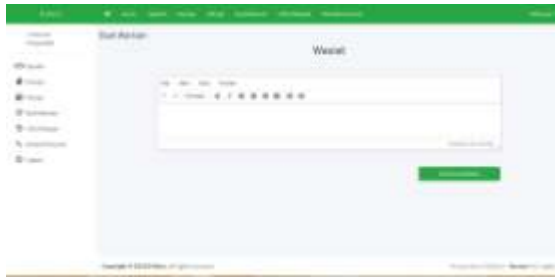
Gambar 13 Halaman Buat Wasiat

Setelah menuliskan surat wasiat yang akan disampaikan pewaris maka masyarakat akan diminta untuk mengunggah berkas pendukung pembuatan warisan.