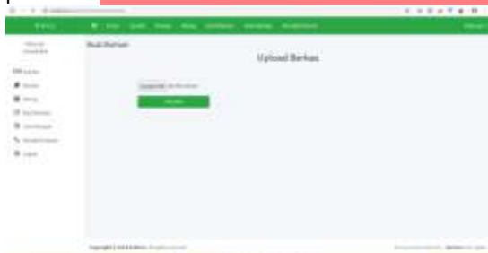
Gambar 14 Upload Berkas

Setelah menuliskan surat wasiat yang akan disampaikan pewaris maka masyarakat akan diminta untuk mengunggah berkas pendukung pembuatan warisan.