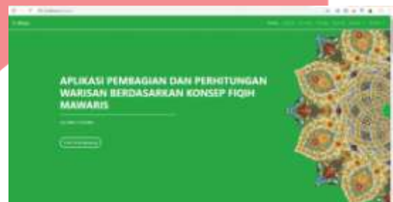
Gambar 16 Halaman Utama

Pada halamana ini merupakan implementasi dari tampilan halaman utama aplikasi.