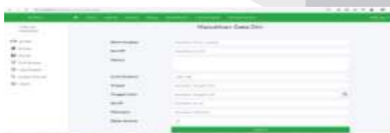
Gambar 9 Buat Warisan 1

Pada halaman ini terdapat menu buat warisan setelah melakukan login. Yang dimana pada menu ini masyarakat akan diminta terlebih dahulu untuk mengisi data diri yang akan membuat warisan serta notaris yang akan menangani surat warisan pewaris tersebut.