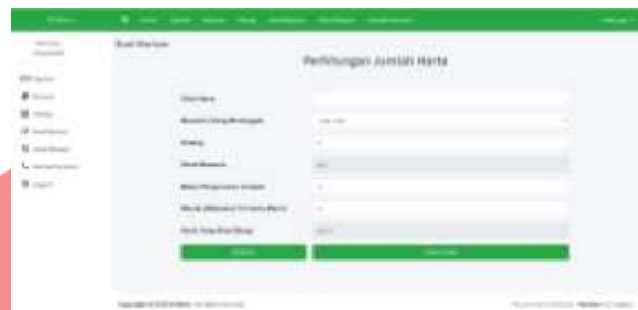
Gambar 10 Buat Warisan 2

Tahap selanjutnya setelah masyarakat melakukan pengisian data diri pewaris dan memilih notaris, maka masyarakat akan diminta untuk memasukkan jumlah harta yang dimiliki pewaris.