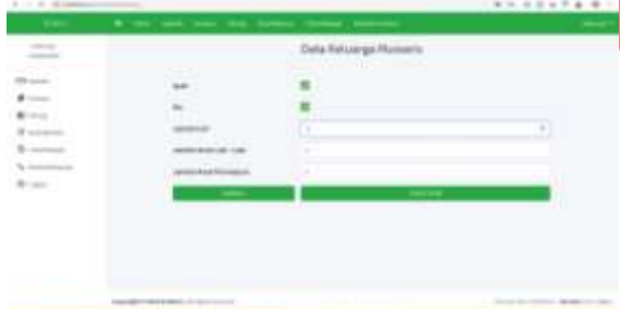
Gambar 7 hitung 2

Pada tahap kedua perhitungan ini masyarakat akan diminta untuk mengisi data keluarga pewaris yang ditinggalkan dan setelah terisi semua maka sistem akan menampilkan hasil dari perhitungan.