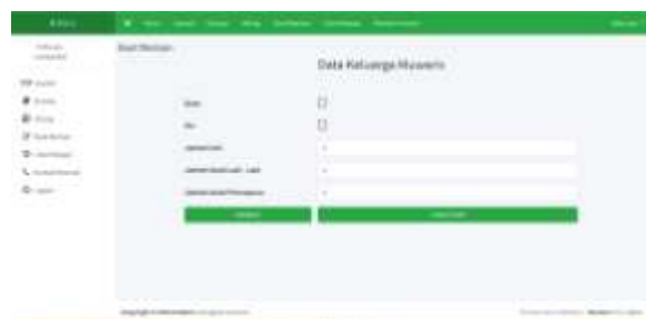
Gambar 11 Buat Warisan 3

Tahap selanjutnya jika masyarakat telah memasukkan total harta yang dimiliki pewaris yaitu masyarakat akan diminta untuk memasukkan data keluarga pearis yang ditinggalkan.