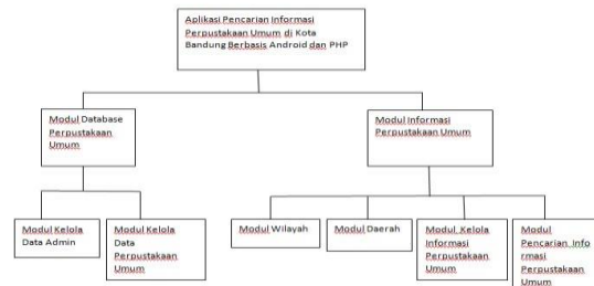
Gambar 2.3 Struktur Modul Aplikasi Pencarian Informasi Perpustakaan Umum Di Kota Bandung Berbasis Android dan PHP

Aplikasi pencarian informasi perpustakaan umum di Kota Bandung berbasis android dan PHP terdapat 6 modul yang akan dibangun. Gambaran ke-6 modul tersebut dapat terlihat pada gambar di bawah ini.