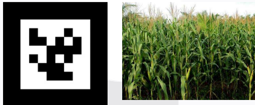
Gambar 2.1 Marker [4],[5]

Marker yang dimaksud disini adalah pola yang dibuat dalam bentuk gambar yang akan dikenali oleh kamera. Pola marker dapat dibuat dengan Photoshop . Untuk marker standar, pola yang dikenali adalah pola marker dengan bentuk persegi dengan kotak hitam di dalamnya. Tetapi, saat ini sudah banyak pengembang marker yang membuat tanpa bingkai hitam misalnya menggunakan gambar atau foto suatu objek [3]. Contoh marker dapat dilihat pada gambar 2.1.