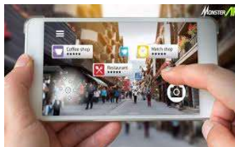
Gambar 2.2 Markerless [7]

Untuk metode yang satu ini bernama Markerless Augmented Reality pada saat ini sedang giat dikembangkan. Keuntungan dari metode ini adalah pengguna tidak lagi memerlukan peralatan tambahan hanya untuk menampilkan berbagai elemen digital. Sebuah perusahaan besar, Total Immersion dan Qualcomm, sudah memproduksi berbagai teknik untuk markerless tracking . Diantara Teknik tersebut adalah Motion Tracking , Face Tracking , GPS Based Tracking , dan juga 3D Object Tracking [6]. Contoh markerless dapat dilihat pada gambar 2.2.