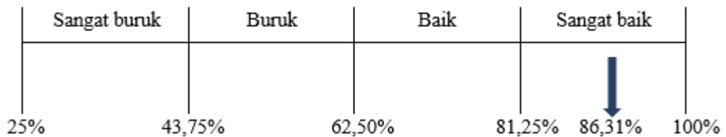
Gambar 3. Garis Kontinum Variabel Minat Beli (Y)

Hasil dari pengolahan data pada Variabel Content Marketing dapat diperoleh hasil rata-rata sebesar 86,31% dikategorikan sangat baik, dapat dilihat pada garis kontinum dibawah ini :