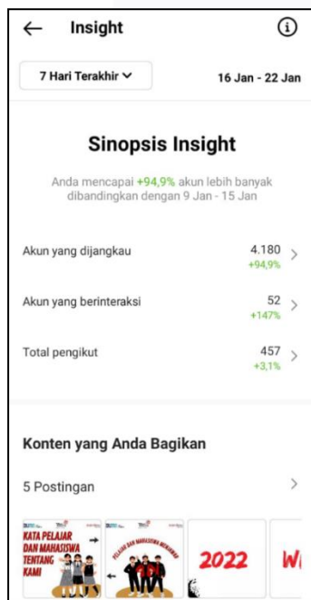
GAMBAR 4 (Insight Awal Instagram Telkom Sragen)

PT Telkom Indonesia Datel Sragen memberikan isi konten yang menginformasikan seputar produk,