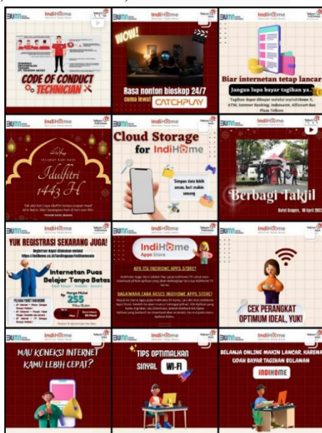
GAMBAR 3 (Konten Instagram @indihomesragen)

Penerapan konten marketing media sosial Instagram pada akun @indihomesragen tahun 2022 mengacu pada empat dimensi yang telah dijelaskan menurut Chris Hauer dalam Alba (2020:18) yaitu context , communication , collaboration dan connection .