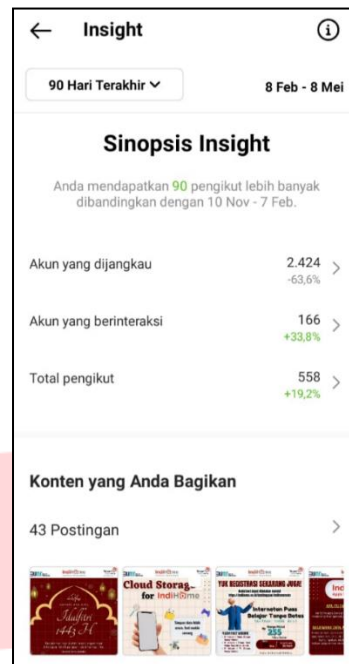
GAMBAR 5 (Insight Akhir Instagram Telkom Sragen)

Berdasarkan pada Instagram insight akun @indihomesragen di atas, dapat dilihat bahwa ada kenaikan pada interaction (dari 52 menjadi 166) dan follower (dari 457 menjadi 558) pada insight Instagram yang diakses pada 22 Januari 2022 (awal) dan pada 08 Mei 2022 (akhir).