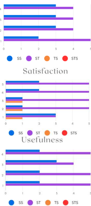
GAMBAR 1 GRAFIK RESPONDEN

Berdasarkan hasil perhitungan, 84,81% responden setuju dan sangat setuju bahwa aplikasi telah berhasil menerapkan efektivitas dalam fitur-fiturnya. Sebanyak 83,03% setuju dan sangat setuju bahwa aplikasi menerapkan kegunaan, dan 79,29% responden setuju dan sangat setuju bahwa aplikasi menerapkan kepuasan.