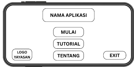
Gambar 2 mockup tampilan menu utama

Pada tahap ini penulis mulai membuat mockup sebagai rancangan tampilan antar muka (user interface). Tampilan ini dirancang agar informatif, mudah dipahami dan mendukung akses cepat ke fitur utama aplikasi. Contoh salah satu mockup yang telah dibuat dapat dilihat pada gambar 2.