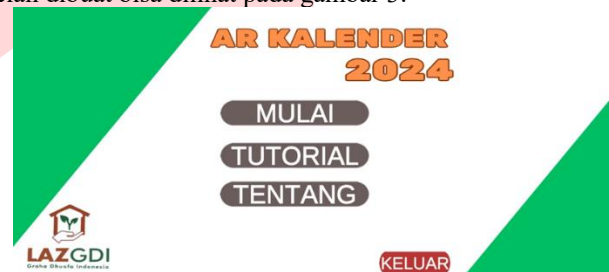
Gambar 3 Tampilan Halaman Utama Aplikasi

Pada tahap ini, penulis mulai membangun aplikasi AR Kalender Graha Dhuafa 2024 menggunakan Unity dan Vuforia SDK. Implementasi dilakukan berdasarkan mockup antarmuka dan alur navigasi yang telah dirancang sebelumnya. Salah satu hasil dari rancangan mockup yang telah dibuat bisa dilihat pada gambar 3.