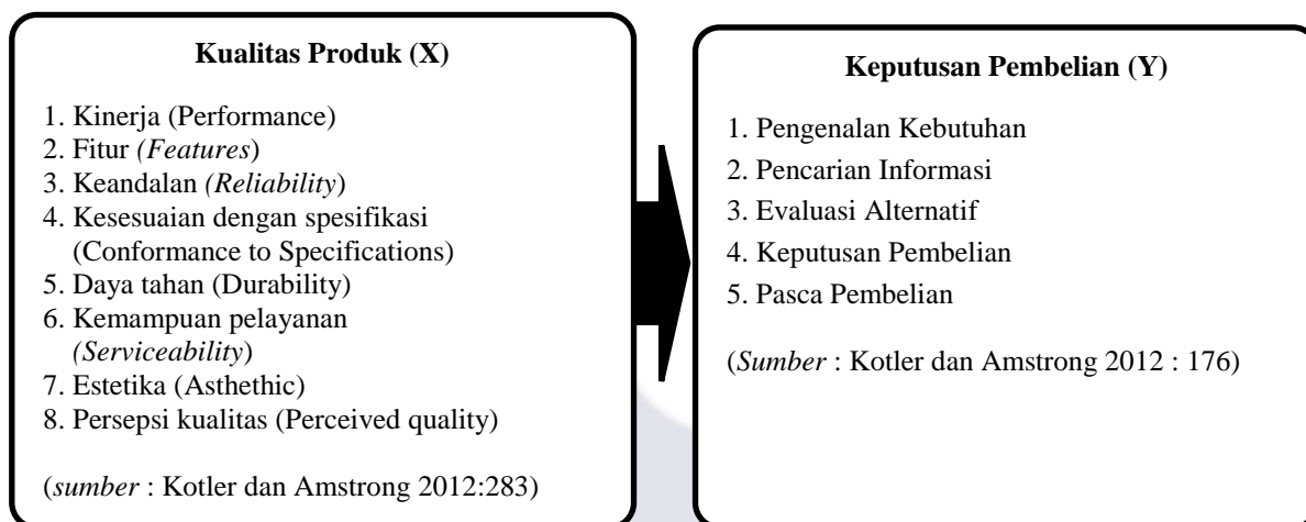
Gambar 3 Kerangka Pemikiran