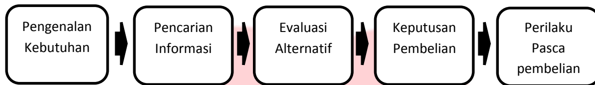
Gambar 2 Proses Keputusan Pembelian

Menurut Kotler dan Amstrong (2012:176), tahapan dalam proses pengambilan keputusan pembelian terdiri dari lima tahap, yaitu: