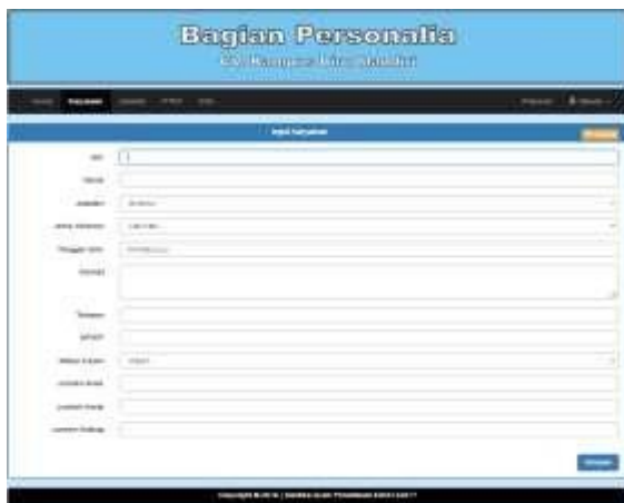
Gambar 1 Data Karyawan