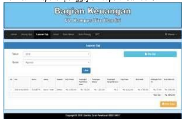
Gambar 3 Laporan Penggajian

Berikut ini laporan penggajian seperti Gambar 3.