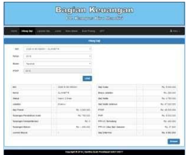
Gambar 2 Perhitungan Gaji

Berikut ini perhitungan gaji seperti Gambar 2