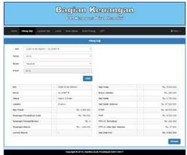
Gambar 2 Perhitungan Gaji

Berikut ini perhitungan gaji seperti Gambar 2