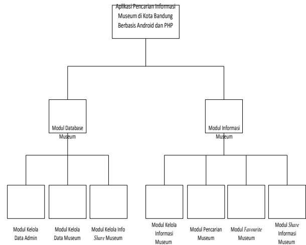
Gambar 2.3 Struktur Modul Aplikasi Pencarian Informasi Museum Di Kota Bandung Berbasis Android dan PHP

Aplikasi Pencarian Informasi Museum di Kota Bandung Berbasis Android dan PHP ini memiliki 7 modul yang nantinya akan dibangun. Gambaran modul-modul tersebut sebagai berikut.