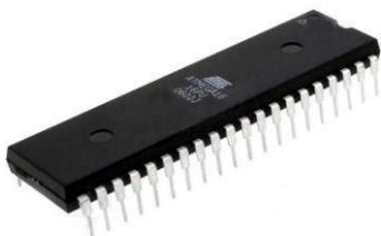
Gambar 1. Mikrokontroler AT Mega 16

AT Mega 16 mempunyai throughput mendekati 1 MIPS per MHz membuat desainer system untuk mengoptimasi konsumsi daya versus kecepatan proses.