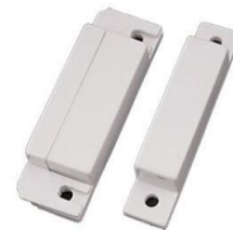
Gambar 2. Reed Switch

Reed Switch merupakan switch yang bekerja berdasarkan ada tidaknya medan magnet yang mempengaruhi switch. Switch ini berbentuk tabung yang didalamnya mempunyai 2 buah lempengan logam yang terbuat dari nikel besi (NiFe) dimana secara umum keadaan reed switch ini adalah normally open. Ketika magnet diletakkan di dekat reed switch maka yang terjadi adalah lempengan logam di dalam tabung akan menempel jika magnet di dekatkan dan switch ini akan tersambung sehingga keadaannya adalah normally closed. Ketika magnet dijauhkan dari switch ini, maka reed switch akan kembali ke posisi semula yaitu normally open.