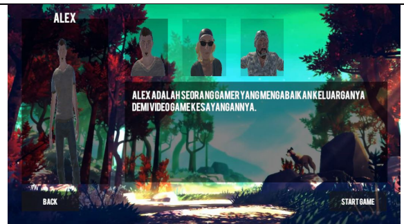
Gambar 4. 2 Pilih Karakter