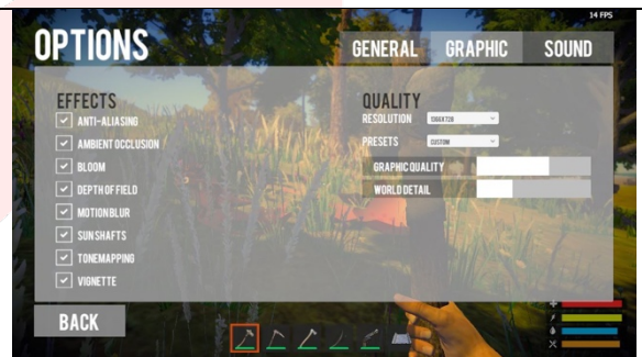
Gambar 4. 4 Graphic Setting