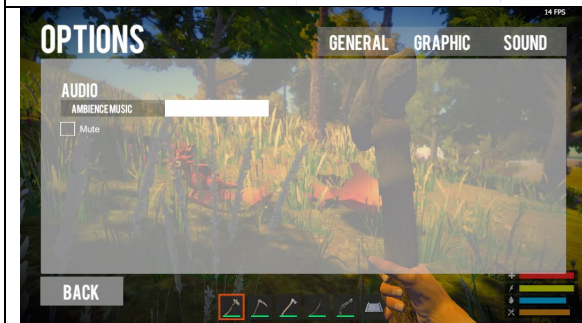
Gambar 4. 5 Sound Setting