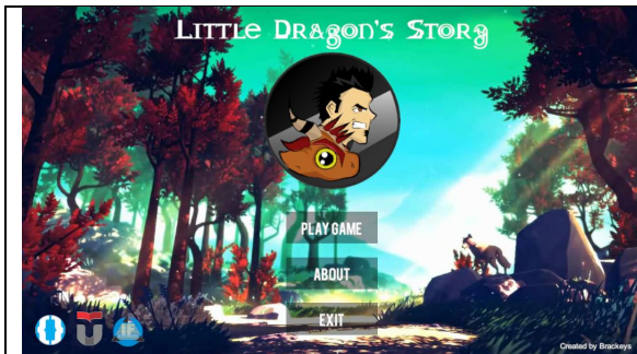
Gambar 4. 1 Main Menu

Berikut antarmuka dari perancangan yang telah di implementasikan :