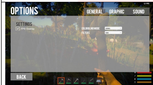
Gambar 4. 3 General Setting