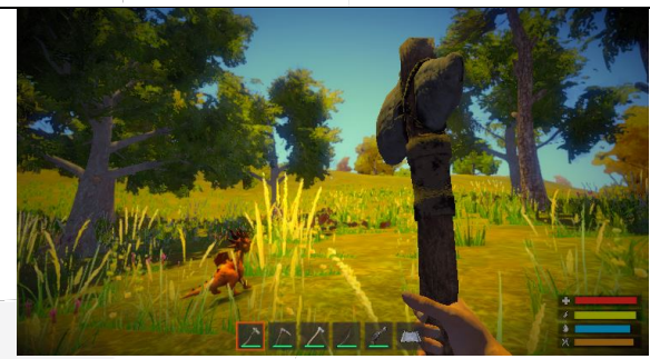
Gambar 4. 6 Gameplay