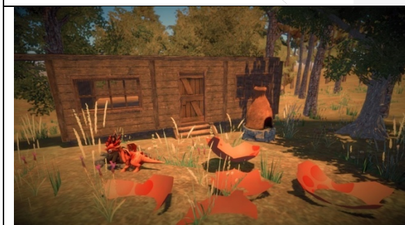
Gambar 4. 7 Gameplay dengan Colorblind Mode