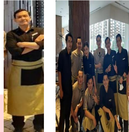
Gambar 4.2.1