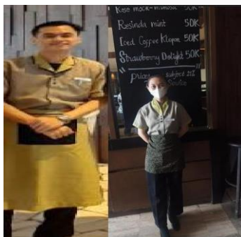
GAMBAR 4.2.1