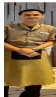
GAMBAR 4.2.1