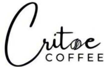
Gambar 1. 1 Logo Critoe Coffee

memiliki luas 3x3x3 (panjang x lebar x tinggi). Kedua dilihat dari segi rasa dan aromanya yang unik dan harum. Lantaran keunikan inilah yang dapat menciptakan para wisatawan domestik luar negeri juga merasa tertarik untuk berkunjung ke Critoe Coffee menikmati khasnya rasa kopi cikole.