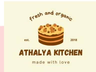
GAMBAR 1 LOGO ATHALYA KITCHEN

Target dari Athalya Kitchen sendiri adalah untuk anak-anak, mahasiswa, karyawan/pegawai kantor hingga ibu-ibu. Karena segmen ini sangat tepat, bila dilihat dari segi tren anak muda masa kini yang gemar dengan makanan berpenampilan modern dan praktis, maka bisnis kuliner ini pasti banyak digemari. Selain itu, produk dari Athalya Kitchen juga sangat cocok untuk dihidangkan saat perayaan hari besar seperti hari raya Idul Fitri dan acara natal akhir tahun. (Data Perusahaan, 2022).