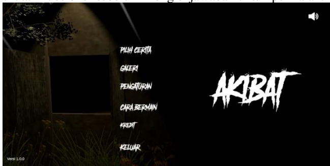
Gambar 2. Aplikasi hasil implementasi

kemudahan penggunaan fitur-fitur aplikasi oleh pengguna akhir, yang merupakan kalangan usia 12 tahun ke atas. Pengguna diarahkan untuk mencoba aplikasi berdasarkan urutan kuesioner sebelum mengisi jawaban untuk penilaian.