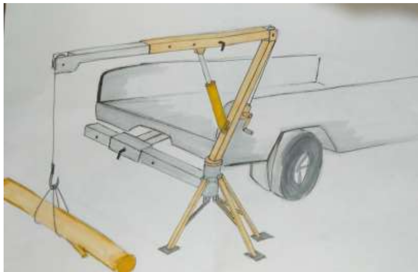
Gambar 1.4 Sketsa Terpilih