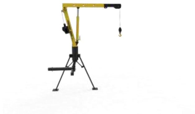
Gambar 1.4 Sketsa 3D