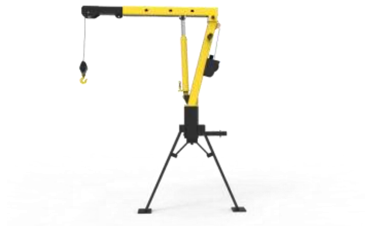
Gambar 1.5 Sketsa 3D