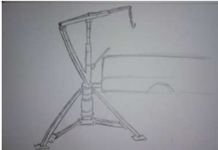
Gambar 1.3 Sketsa Alternatif