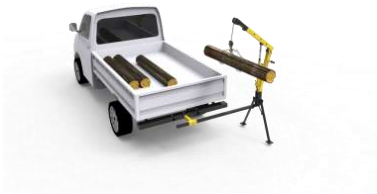
Gambar 1.7 Sketsa 3D