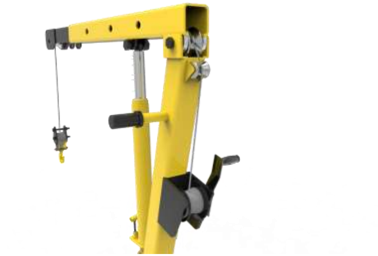
Gambar 1.6 Sketsa 3D