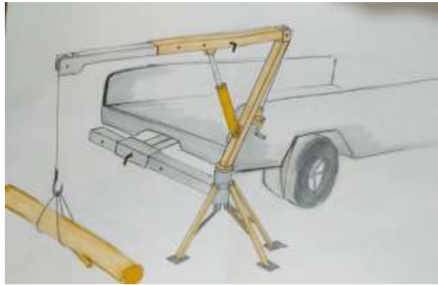
Gambar 1.1 Sketsa Alternatif