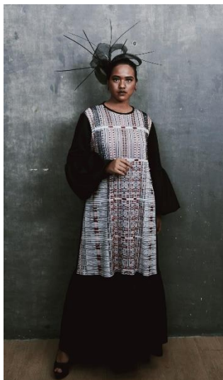
Gambar 9. Visualisasi Desain Busana 4