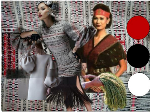
Gambar 1. Imageboard

Patuduhon Hasangaponna , yang artinya: Lebarnya menunjukkan kecantikannya, Panjangnya menunjukkan kehormatannya. Untuk itulah penulis membuat garis rancangan maxi dress pada desain koleksi busana ini.