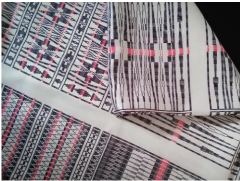
Gambar 4. Teknik Textile Printing pada Bahan Velvet

Pada tahap ini, penulis mengembangkan eksplorasi yang sebelumnya telah dilakukan yaitu dengan menerapkan motif digital yang telah diperoleh dengan mengaplikasikannya ke berbagai material tekstil. Penerapan motif digital pada berbagai material tekstil dilakukan melalui teknik textile printing , hal ini dilakukan untuk mengetahui potensi dari berbagai jenis bahan jika diaplikasikan motif digital Ulos Tumtuman ini. Beberapa jenis material bahan yang telah diaplikasikan dengan teknik textile printing ini adalah bahan: Velvet, Organza, Tulle, Linen, Polycotton, Satin, Scuba, Taffeta.