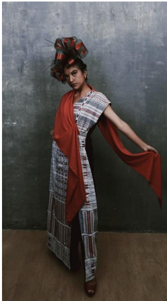
Gambar 8. Visualisasi Desain Busana 3