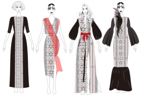
Gambar 5. Desain Pakaian Ready to Wear Deluxe

Berdasarkan hasil data yang di peroleh dari berbagai eksplorasi yang telah dilakukan, berikut merupakan 4 alternatif rancangan produk busana wanita dengan konsep busana ready to wear deluxe .