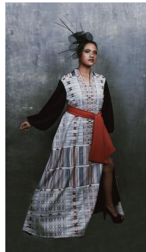
Gambar 6. Visualisasi Desain Busana 1