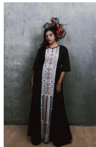
Gambar 7. Visualisasi Desain Busana 2