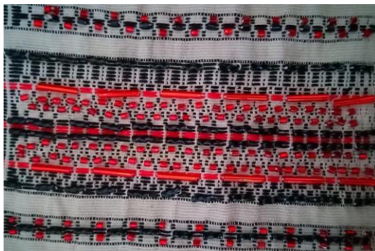
Gambar 2. Komposisi Beading

Pada tahap awal eksplorasi penulis mencoba menerapkan aplikasi embellishment beading langsung diatas permukaan kain Ulos Tumtuman, dengan berbagai alternatif komposisi beading .