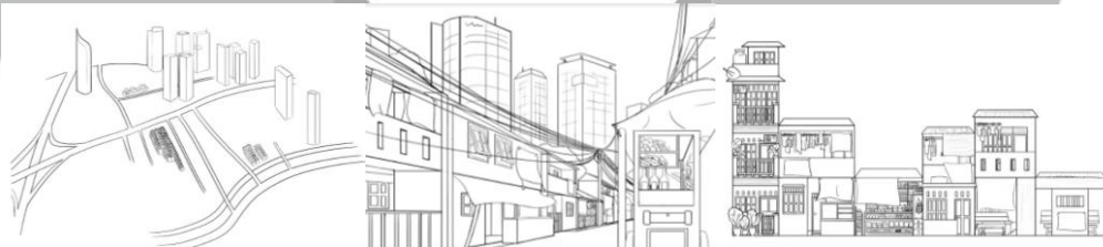
Gambar 3.3 Sketsa Environment