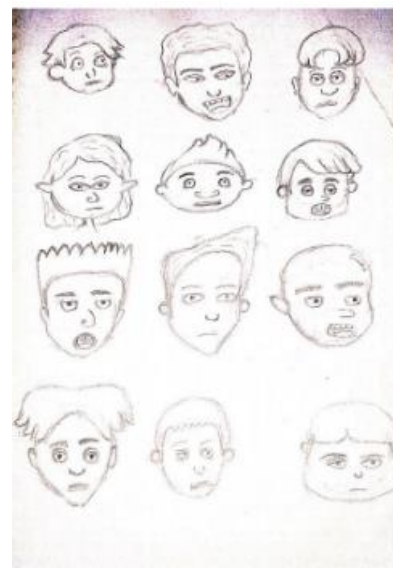
Gambar 3.2 Sketsa Penerapan Gaya Visual