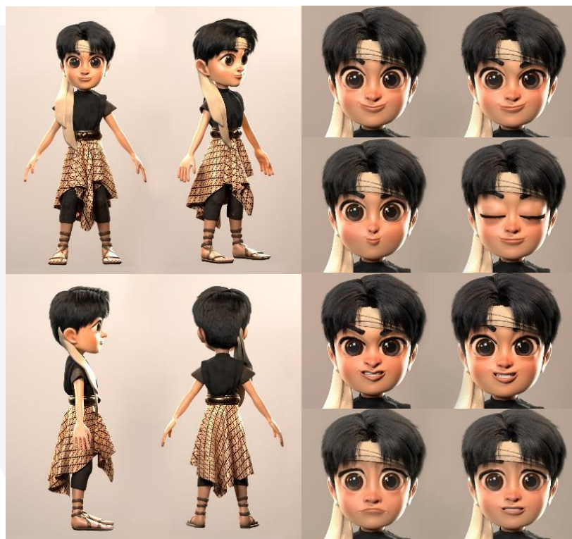
Gambar 3. Sampel 3D karakter desain Mundinglaya

Setelah melakukan eksplorasi sketsa manual, maka tahap selanjutnya sketsa akan diolah kedalam bentuk 3D karakter menggunakan beberapa software 3D.