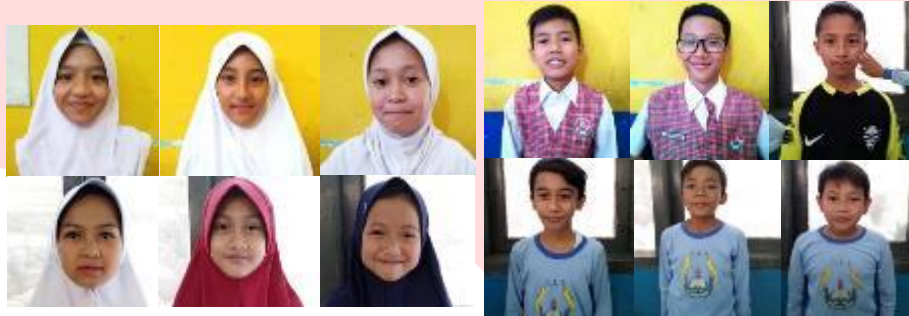
Gambar 1. Sampel Wajah Anak Sunda

Kemudian melakukan pengamatan tentang fisik wajah yang kemudian dianalisis, mulai dari besar mata, alis, hidung, mulut, telinga, dan rambut. Pengamatan ini menggunakan cara dengan menumpuk foto satu persatu untuk mendapatkan analisis yang lebih terfokus. Para sampel ini akan menjadi referensi wajah pembuatan karakter film animasi yang digunakan sebagai tokoh utama laki-laki dan perempuan. Selain itu, juga mengamati gaya berpakaian para sampel, dari model pakaiannya hingga warna apa yang sering dipakai dalam hal berpakaian.