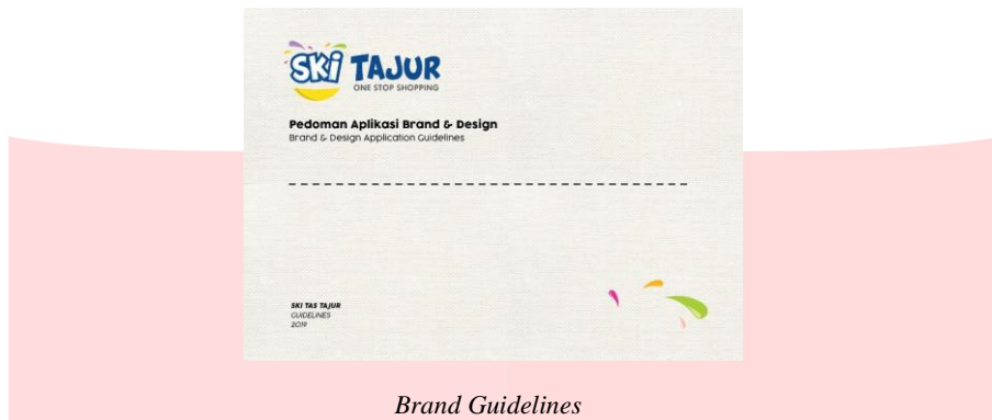
Brand Guidelines