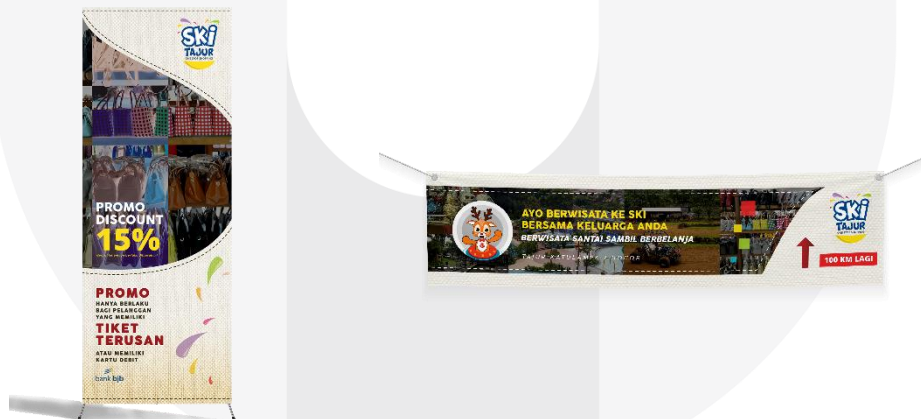
X Banner & Spanduk