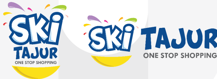
Logo Sumber Karya Indah