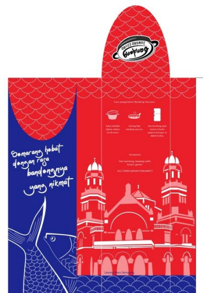
Gambar. 4.17 Struktur dan surface kemasan bandeng juwana elrina

Penulis membuat ilustrasi lawang sewu yang digunakan sebagai ilustrasi pada kemasan bandeng juwana elrina. Ilustrasi Lawang Sewu disisipkan dengan tujuan agar pembeli atau konsumen yang melihat kemasan tersebut segera mengetahui bahwa bandeng merupakan makanan khas yang berada di Semarang. Selain itu Lawang Sewu juga merupakan ikon pariwisata Semarang yang sangat terkenal, sehingga secara tidak langsung, dari kemasan tersebut memiliki fungsi estetika, namun juga promosi budaya dan pariwisata, sekaligus membuat identitas dari kemasan Bandeng Juwana Elrina bersinergi dengan kota Semarang.