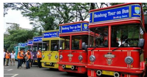
Gambar 2 Bis Bandros

Warna pada Bandros bukan sekedar untuk mempercantik saja, tapi untuk menandakan jalur yang akan diambil. Bandros memiliki 5 warna merah, biru, hijau, kuning, ungu, dan hitam untuk vip. Warna merah akan mengelilingi sekitaran gasibu cihampelas dan balik ke gasibu, warna ungu dari gasibu hingga pusdai, warna kuning dari gasibu hingga braga, warna biru dari alun-alun Bandung sampai buah batu, dan yang hitam khusus untuk para tamu penting seperti petinggi, presiden dan para tamu vip lainnya.