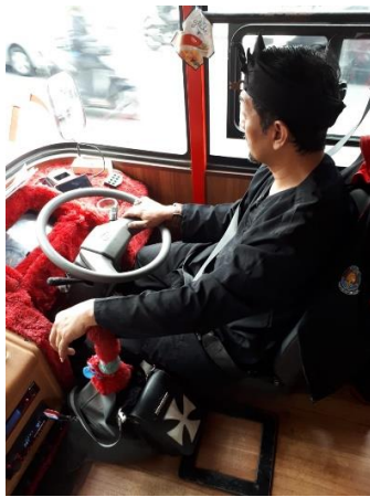
Gambar 3. Dashboard Bandros