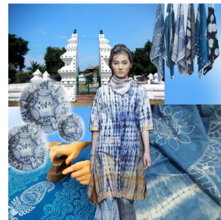
Gambar 1. Konsep Imageboard

Moodboard dirancang dengan inspirasi block printing dan tie dye , dengan menggunakan motif yang terinspirasi dari porselen yang ada pada arsitektur keraton Kanoman. Dalam pemilihan warna menyesuaikan dengan warna-warna yang terdapat pada warna paling dominan yang ada pada arsitektur keraton Kanoman.