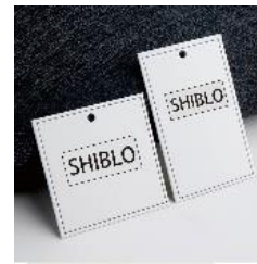
Gambar 6. Label dan Hangtag

Label dan Hangtag adalah salah satu kelengkapan dalam konsep merchandise pada sebuah brand . Pada desain hangtag menampilkan logo dan nama koleksi itu sendiri.