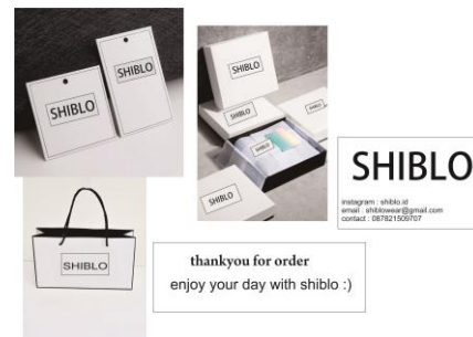
Gambar 8. Packaging