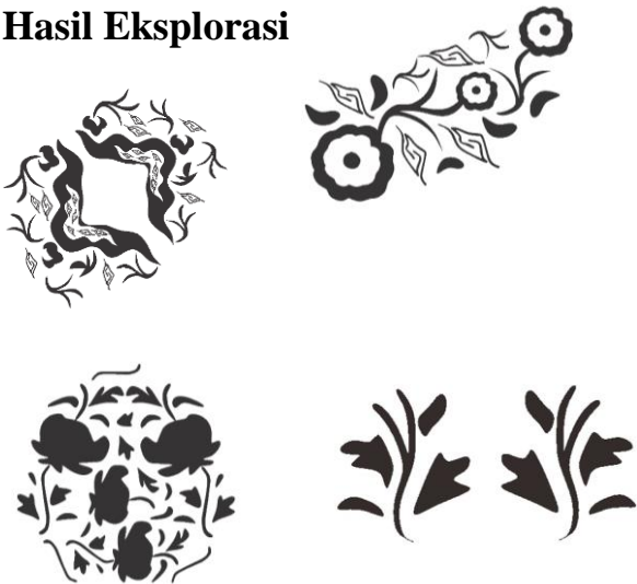
Gambar 3. Stilasi Motif

Setelah melakukan beberapa eksplorasi stilasi motif, melalui pertimbangan jenis motif, ketebalan hingga ukuran garis, maka hasil yang paling memungkinkan untuk direalisasikan menjadi cetakan block yaitu keempat motif flora.