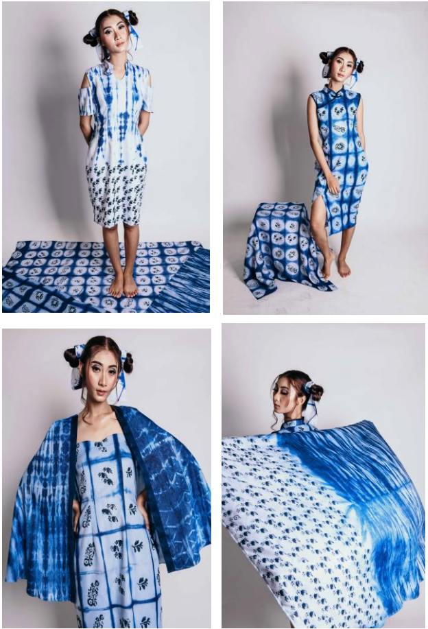
Gambar 9. Visualisasi Produk

Produk ini menggunakan material kain katun linen look dengan menggunakan motif yang terinspirasi dari porselen pada arsitektur keraton Kanoman. Dengan menggabungkan teknik block printing dan tie dye . Motif diterapkan di beberapa busana sesuai dengan desain yang dibuat.