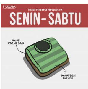
Gambar II.23 SeragamBebas FIK