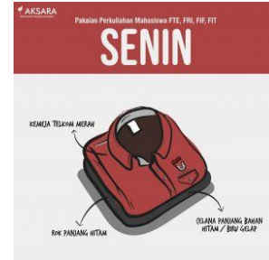
Gambar II.18 Seragam hari Senin