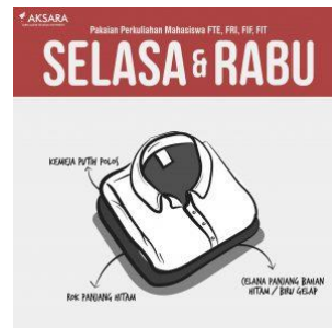
Gambar II.19 Seragam hari Selasa & Rabu