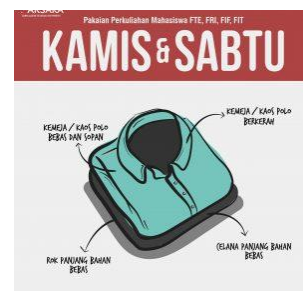
Gambar II.20 Seragam hari Kamis & Sabtu