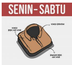
Gambar II.22 Seragam hari Senin s/d Sabtu FEB & FKB