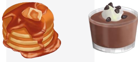
Gambar 3.1 Ilustrasi Makanan