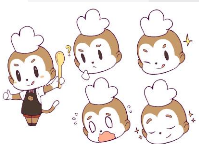
Gambar 3.2 Ilustrasi Desain Karakter