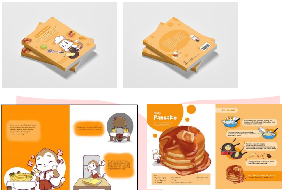
Gambar 3.3 Media Utama