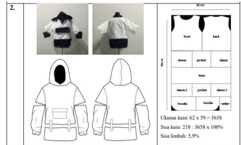
Tabel 1. Eksperimen desain 1 (sumber: Sonjaya. G, 2020)