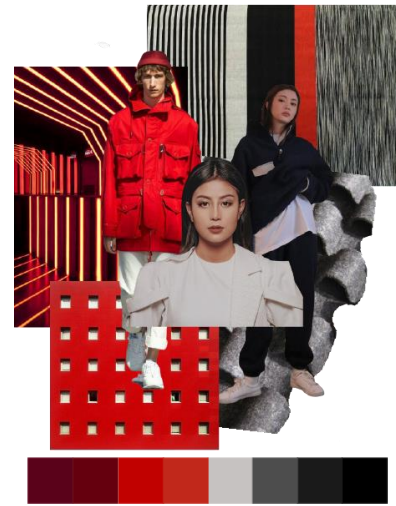
Gambar 5. Moodboard

Konsep pada penelitian ini memiliki bentuk busana geometris yang dirancang menggunakan konsep zero waste untuk meminimalisir limbah pasca proses produksi serta mengoptimalkan penggunaan kain diatas 85% [5]. Menggunakan tema “Zominate” yang merupakan gabungan kata dari generasi “Z” dan dominate atau dominasi. Berfokus pada generasi Z yang termasuk kedalam kata kunci dari trend forecast Indonesia Fashion Week 2020. Konsep ini menggambarkan generasi z sebagai calon generasi penerus, karena memiliki kemampuan terhadap perkembangan teknologi. Penggunaan warna hitam, merah dan abu-abu memberikan kesan yang tangguh, berani, dan bergairah. Pengaplikasian fitur transformasi dan penambahan scotlight sebagai detail menambah kesan futuristik dan estetika pada busana.