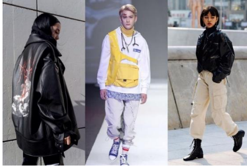
Gambar 3. Edgy Look

Memiliki tampilan yang lebih berani dengan mengkombinasikan material leather , aksesoris chain dan penggunaan warna-warna gelap.