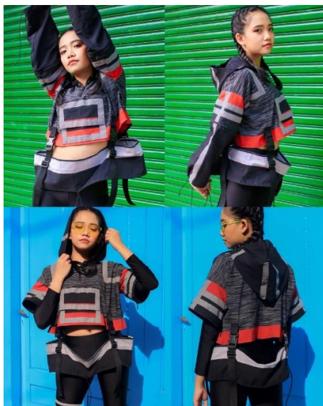
Gambar 6. Look 1

Pada look pertama, merupakan pullover dengan siluet oversize. Pada busana ini menggunakan buckle belt pada bagian pinggang baju sebagai nilai estetika. Dan penempatan fitur transformation pada hoodie dan bagian lengan yang bisa diubah menjadi lengan pendek atau panjang dengan menggunakan resleting.