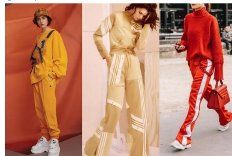
Gambar 2. Sporty Look