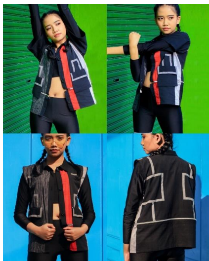
Gambar 7. Look 2

Pada look pertama, merupakan pullover dengan siluet oversize. Pada busana ini menggunakan buckle belt pada bagian pinggang baju sebagai nilai estetika. Dan penempatan fitur transformation pada hoodie dan bagian lengan yang bisa diubah menjadi lengan pendek atau panjang dengan menggunakan resleting.