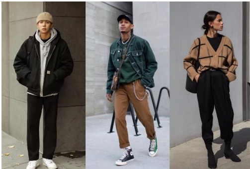
Gambar 4. Chic Look

Tampilan minimalis dan terkesan rapi menjadi ciri khas dari chic look . Item busana formal seperti blazer dan kemeja kerap dikombinasikan dengan item busana kasual seperti kaos dan jeans .