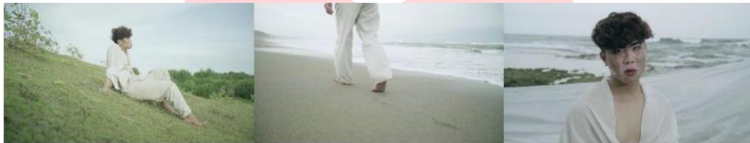
Gambar 5 Screen Shot Cuplikan “The Edge of The Sea”

Bait terakhir ini dimulai dari adegan model (s) terbagun di ladang, dengan menggunakan pakaian yang sama dengan bait pertama. Bait ini dimulai dari kalimat pertanyaan yang mengulang pada bait pertama yaitu “Have you heard the sound yet?”, apakah kita sudah “mendengar” suara alam?, Beralih dari yang asalnya antroposentris menjadi ekosentris. Adegan selanjutnya adalah model (s) berjalan di tepi pantai di reverse, kemudian adegan selanjutnyapun masih tetap di reverse model (s) keluar air, pada adegan tersebut kalimatnya yaitu “to veer the line”, banyak adegan yang di revers dan berhubungan dengan kalimat dalam narasi menggambarkan bahwa memutar balikan pemikiran dan pemahaman dari yang awalnya abai dan kurang peduli menjadi sebaliknya. Adegan selanjutnya adegan dimana model (s) memandang pantai – alam dengan narasi “For not letting the beauty of the Nature”, di titik ini ketika manusia menyadari akan suara alam, Adegan terakhir adalah posisi model (s) berada di tengah frame, yang asalnya menunduk kemudian secara perlahan memandang jelas ke arah kamera dan muncul kalimat “To just become a story for the future”