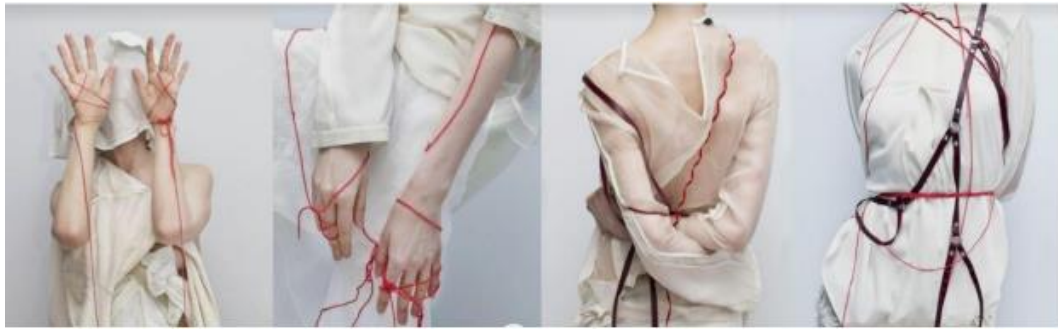
Gambar 1 Referensi Pakaian 4

Pakaian pertama adalah pashmina putih yang di kenakan semi outer menggunakan sabuk kain, dan celana putih ;pakaian kedua adalah kimono hitam dan ceana hitam; kemudian pakaian ketiga adalah kimono hitam dan celana hitam yang di cat akrilik; dan yang terakhir adalah pakaian keempat adalah kain blacu yang dililit benang merah dan celana berwarna putih.