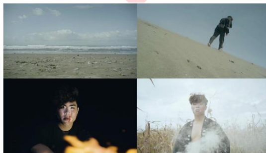
Gambar 3 Screen Shot Cuplikan “The Edge of The Sea”

or the temperature would increasingly like a skyrocket