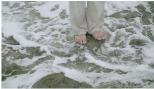
Gambar 2 Screen Shot Cuplikan "The Edge of The Sea"

Pada cuplikan opening, terdapat visual dari kaki model yang berdiri di atas karang. Kakinya terkena terjangan air ombak. Namun gambar cuplikan diadegankan tersebut diedit secara terbalik (reverse). Video ini di buka dengan cuplikan kaki di atas batu yang dikelilingi air ombak sama sesuai judul karya ini yaitu "The Edge of The Sea" dimana merepresentasikan manusia di ujung tanduk kehidupan. Makna dari adegan ini merupakan representasi dari situasi yang seakan akan "manusia yang berada di ujung tanduk" hal ini di perkuat oleh kaki model yang berdiri sendiri di tengah karang kecil dan diterjang oleh air ombak, efek reverse di awal video bertujuan agar lebih mudah mendapat atensi penonton.