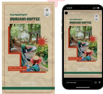
Gambar 4.7 Instagram ads

Instagram Ads digunakan untuk dapat menyasar target audiens yang sering menggunakan sosial media dalam kesehariannya.