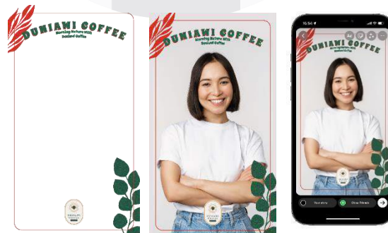
Gambar 4.13 Filter instagram