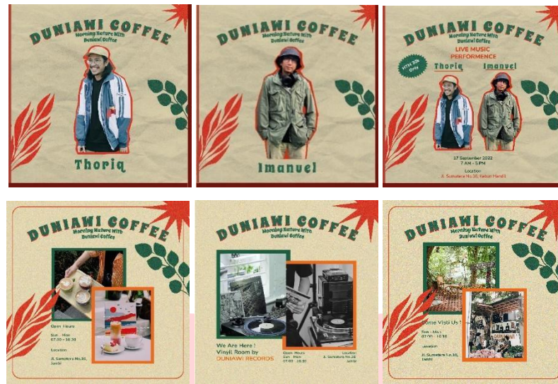
Gambar 4.10 Feed instagram

Poster digital berikut akan di tayangkan pada media sosial Instagram Post Duniawi Coffee. berisi tentang informasi yang berhubungan dengan Duniawi Coffee yang dimana berisi menu-menu yang disediakan dan beberapa fitur-fitur dalam Duniawi Coffee serta informasi event yang akan diselenggarakan Duniawi Coffee.