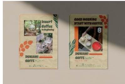
Gambar 4.6 Poster cetak

Poster akan ditempatkan di beberapa kampus di kota jambi yang untuk mendapatkan perhatian target audiens dengan pemilihan Visual menggunakan Konsep soft selling .