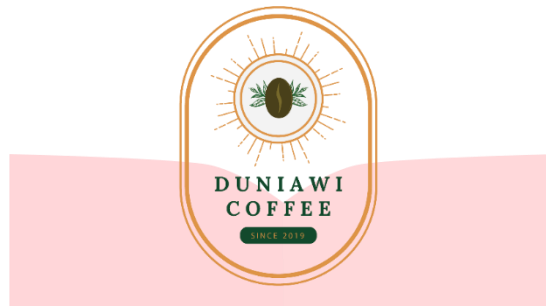
Gambar 4.5 Logo

Dalam perancangan promosi ini logo dibutuhkan untuk penerapan di berbagai media yang dipakai. Dikarenakan pemakaian logo Duniawi Coffee sebelumnya tidak konsisten. Logo diatas menggabungkan gambar dan tulisan yang dikategorikan ke dalam logo kombinasi.