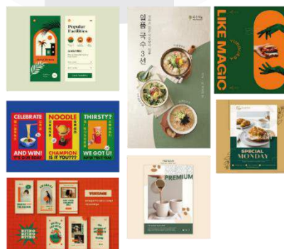
Gambar 4.1 Gaya visual