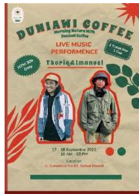
Gambar 4.8 Poster digital

Poster digital ini berisi tentang informasi event yang akan diadakan Duniawi Coffee yang dimana di dalam poster tersebut menampilkan gabungan fotografi dan sedikit ilustrasi yang dapat menarik perhatian target audiens untuk event Live Music ini.