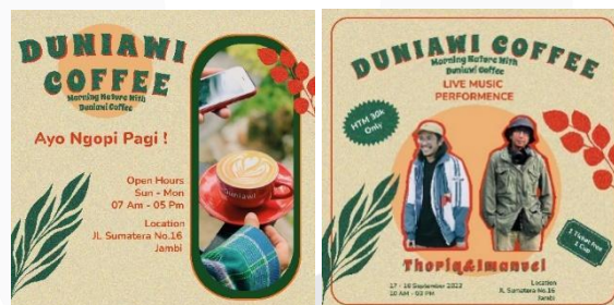
Gambar 4.9 Motion Visual

Motion visual disini ditempatkan di Instagram Duniawi Coffee. Pemilihan media motion digunakan untuk menarik perhatian lebih terhadap audien karena dengan adanya motion , penonton akan tertarik untuk melihat dari pada gambar diam. Hal tersebut dapat dibuktikan dari statistic Instagram yang lebih banyak penonton melihat video daripada foto atau gambar diam. Secara algoritma pun Instagram mendahulukan konten video dari pada foto.