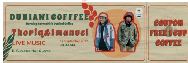
Gambar 4.12 Tiket

Tiket ini merupakan tanda bukti transaksi untuk event live music yang diadakan Duniawi Coffee. Tiket tersebut juga terdapat kupon untuk mendapatkan minuman gratis untuk setiap satu pembelian.