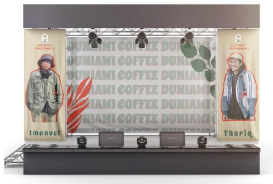
Gambra 4.11 Event live music