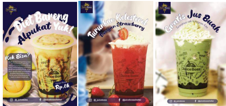
Gambar 5 Desain poster A3