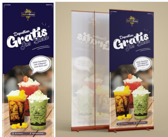
Gambar 6 Desain banner

Banner ini berfungsi sebagai attention target audiens, dimana mereka yang telah mendatangi booth milik Juice Boss dan melihat banner sebagai visual yang cukup besar, mereka akan mulai tertarik membaca headline Gratis sebagai awal mula dan mulai mencari syarat dan ketentuan yang diperlukan untuk mendapatkan diskon yang disebutkan dibanner.