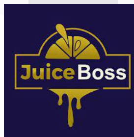
Gambar 1 Logo juice boss

Logonya sendiri tidak mengalami perubahan karena penulis memilih menggunakan logo yang sudah ada.