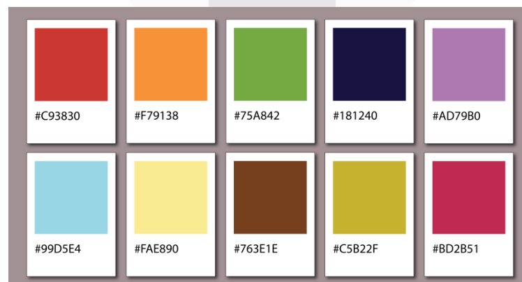
Gambar 3 Warna Yang Digunakan

Warna memegang peran penting salah satu elemen visual dalam pembuatan suatu rancangan visual karena dengan adanya warna visual sebuah desain akan terlihat lebih hidup dan menarik. Pada perancangan ini palet warna yang digunakan menyesuaikan dengan warna buah-buahan seperti merah, hijau, orange dan lainnya.