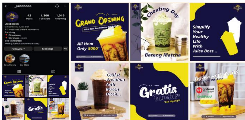
Gambar 8 Desain feeds instagram

Media digital yang juga akan digunakan sebagai bentuk search adalah Instagram, terutama Instagram story dan instagram feeds. Pada media ini, berisi informasi tentang syarat dan ketentuan untuk mendapatkan diskon-diskon yang disediakan Juice Boss pada event.