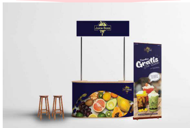
Gambar 4 Design booth

Media action yang akan digunakan adalah booth , yang akan ditempatkan di dekat Idachi Fitness Metro Indah Mall di lantai 2. Booth ini sebagai bentuk pengenalan kepada masyarakat kota Bandung terutama daerah Margahayu, karena toko Juice Boss yang kurang strategis dan jauh dari keramaian kota. Adapun banner yang dipasang disamping booth sebagai bentuk attention kepada target audiens.