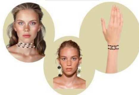
Gambar 6 Sketsa produk aksesoris terpilih