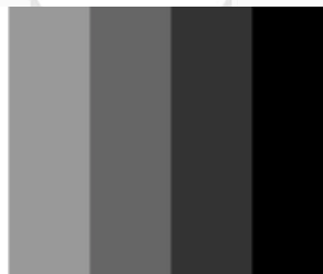
Gambar 2 Warna monokrom hitam dan putih

Monokrom sendiri diartikan sebagai warna tunggal atau satu warna yang didapatkan dari berbagai cahaya, dalam fesyen sendiri monokrom yang biasa dikenal dengan warna hitam dan putih karena warna tersebut termasuk ke dalam warna netral yang tak lekang oleh waktu atau abadi untuk digunakan. Bahkan sebagian orang akan merasa lebih percaya diri jika menggunakan warna hitam dan putih, karena dengan warna tersebut dapat memberikan kesan yang berbeda dan masuk dalam berbagai acara. Penulis akhirnya memutuskan untuk menggunakan warna monokrom hitam dan putih agar produk yang diproduksi akan selalu memiliki tempat walaupun sedang terdapat tren dengan warna lain saat ini dan selain itu untuk menimbulkan kesan yang modern dan tegas agar menumbuhkan kepercayaan diri pada penggunanya