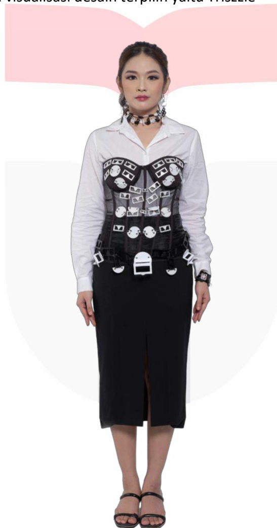
Gambar 8 Visualisasi desain terpilih

Berikut merupakan visualisasi desain terpilih yaitu Triszzle