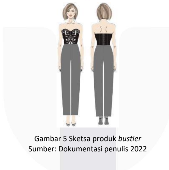
Gambar 5 Sketsa produk bustier

Sketsa produk yang dibuat mengacu pada konsep perancangan yaitu busana ready to wear deluxe , desain tersebut telah disesuaikan dengan imageboard dan target market yang dituju. Item fesyen yang akan dibuat berupa bustier dan beberapa aksesoris seperti belt , anting, kalung dan juga gelang dibuat menggunakan teknik 3D printing dengan filamen polylatic acid dengan inspirasi visual bentuk geometris dan warna monokrom hitam dan putih. Setelah dibuatnya sketsa produk awal, terdapat satu sketsa yang dapat dilanjutkan pada tahap produksi. Dimana dalam pemilihan desain ini didapatkan dari hasil pertimbangan yang matang dari segi siluet, warna, dan penerapan komposisi eksplorasi modul yang dianggap lebih mampu merepresentasikan konsep imageboard . Berikut di bawah ini merupakan desain yang telah terpilih: