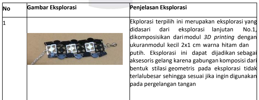
Tabel 1 Data eksplorasi terpilih

Setelah melakukan proses eksplorasi awal, terdapat beberapa eksplorasi yang dianggap lebih unggul dan berpotensi untuk dikembangkan lebih lanjut dengan pertimbangan yang mengarah kepada konsep perancangan produk fesyen. Terdapat beberapa modul yang dapat di komposisikan kembali menjadi satu buah eksplorasi besar pada eksplorasi terpilih. Berikut merupakan eksplorasi terpilih tersebut: