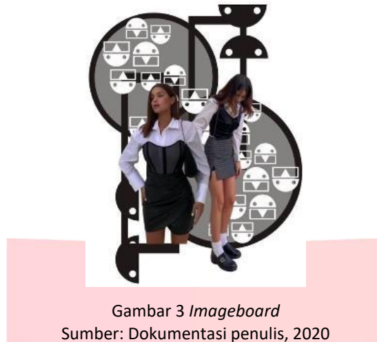
Gambar 3 Imageboard