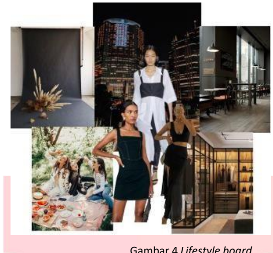
Gambar 4 Lifestyle board