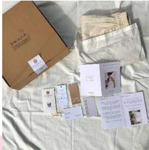
Gambar. 9 Merchandise