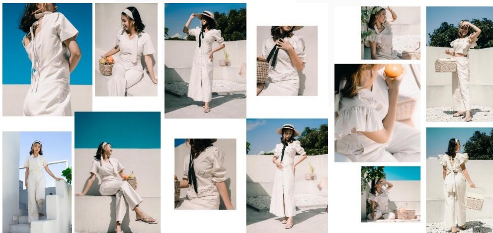
Gambar 5 Visualisasi produk

Berikut ini adalah visualisasi produk dari 3 look yang terpilih sesuai urutan presentase tertinggi: