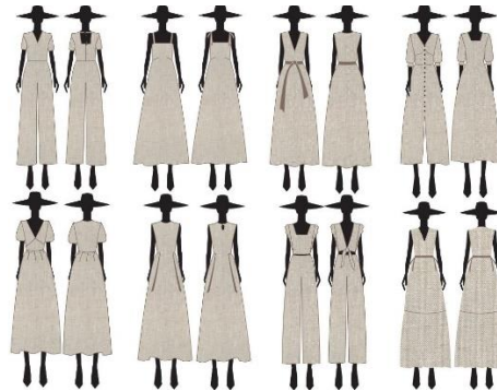
Gambar 3 Sketsa desain produk

untuk kehidupan sehari-hari pada kulit pemakainya dalam cuaca panas sekalipun.