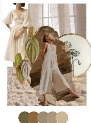
Gambar 1 Imageboard

Konsep perancangan dibuat berdasarkan kebutuhan busana seorang yang menerapkan gaya hidup sehat yang digunakan pada kegiatan berwisata. Terinspirasi dari kesadaran masyarakat itu sendiri terhadap keseimbangan dan kesehatan. Hal ini ada korelasinya dengan salah satu lokal konten yang tidak dapat dipisahkan dari suku masyarakat tertentu di Indonesia, yaitu daun sirih. Dimaknai sebagai penyeimbang dalam acara adat istiadat, daun sirih juga sesuai dengan gaya hidup target market yaitu pelaku gaya hidup sehat. Busana yang ditampilkan berupa dress , one set , dan jumpsuit dengan detail pengolahan teknik tekstil yaitu bordir untuk memberikan unsur tekstur daun sirih dengan warna beige sehingga memberikan kesan natural. Sesuai dengan fungsi bordir sebagai aksesoris pendukung sehingga pengaplikasian bordir pada busana cenderung kecil dan penempatan dibagian sisi busana agar bordir tidak terlalu dominan dan tidak menghilangkan kesan selaras dan harmoni dengan material busana. Berikut merupakan konsep perancangan yang disusun dalam imageboard .