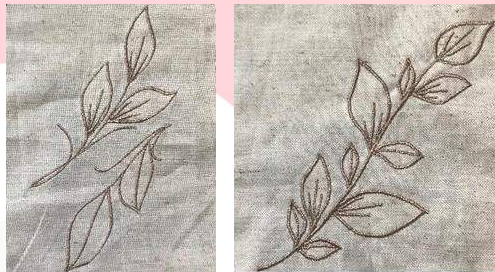
Gambar 2 Eksplorasi terpilih

Bordir adalah suatu elemen untuk mengubah penampilan permukaan kain dengan aneka setik bordir, baik dengan tangan maupun dengan mesin (Yuliarma, 2016). Dalam tahap eksplorasi, penulis bertujuan mencari teknik dan jenis kain yang sesuai serta potensial untuk dilanjutkan dalam penelitian. Terinspirasi dari daun sirih yang telah diketahui secara luas manfaatnya bagi kesehatan, daun sirih ini juga merupakan kearifan lokal yang tidak dapat dipisahkan dari suku masyarakat tertentu di Indonesia seperti suku Melayu yang memaknai daun sirih sebagai “Daun Beradat” serta beberapa suku lainnya di Sumatra, hingga Nusa Tenggara.