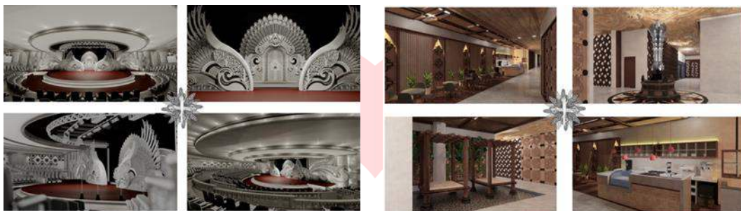
Gambar 1 Suasana yang Diharapkan

Gedung Darma Negara Alaya (DNA) Denpasar merupakan salah satu pusat kesenian yang ada di provinsi Bali, dengan konsep tema tersebut diharapkan redesain gedung Darma Negara Alaya (DNA) dapat menjadi sebuah pusat berkesenian dimana seniman, komunitas seni, serta penikmat seni bisa mengembangkan serta menikmati potensi seni yang ada di provinsi Bali, sekaligus mampu memberikan edukasi seputar kesenian, dan pengunjung agar disediakan wadah spesifik untuk menambah wawasan terhadap dunia kesenian.