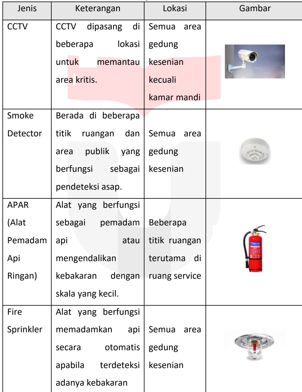
Tabel 5 Konsep Keamanan

Selain furniture yang ramah untuk pengunjung dengan segala usia, adanya pengunjung dengan ragam usia, diperlukan keamanan pada semua area agar dapat meminimalisir kecelakaan yang terjadi pada pengguna ruang.