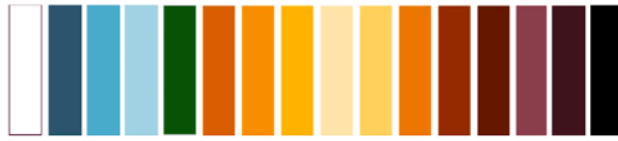
Gambar 2 Pallette Warna