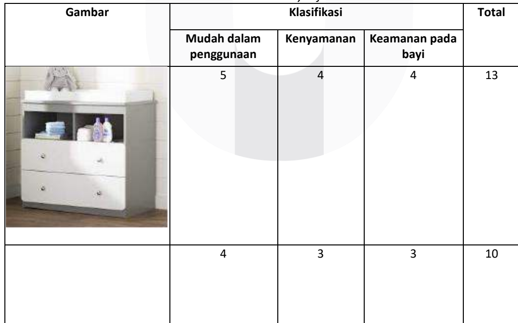
Tabel 3 Bentuk Baby tafel

Dalam perancangan baby tafel dibutuhkan parameter untuk mentukan metode dan sistem yang sesuai digunakan untuk produk, akan digunakan dengan tingkatan 1-5. Semakin besar angka yang di dapat semakin mendekati kebutuhan.