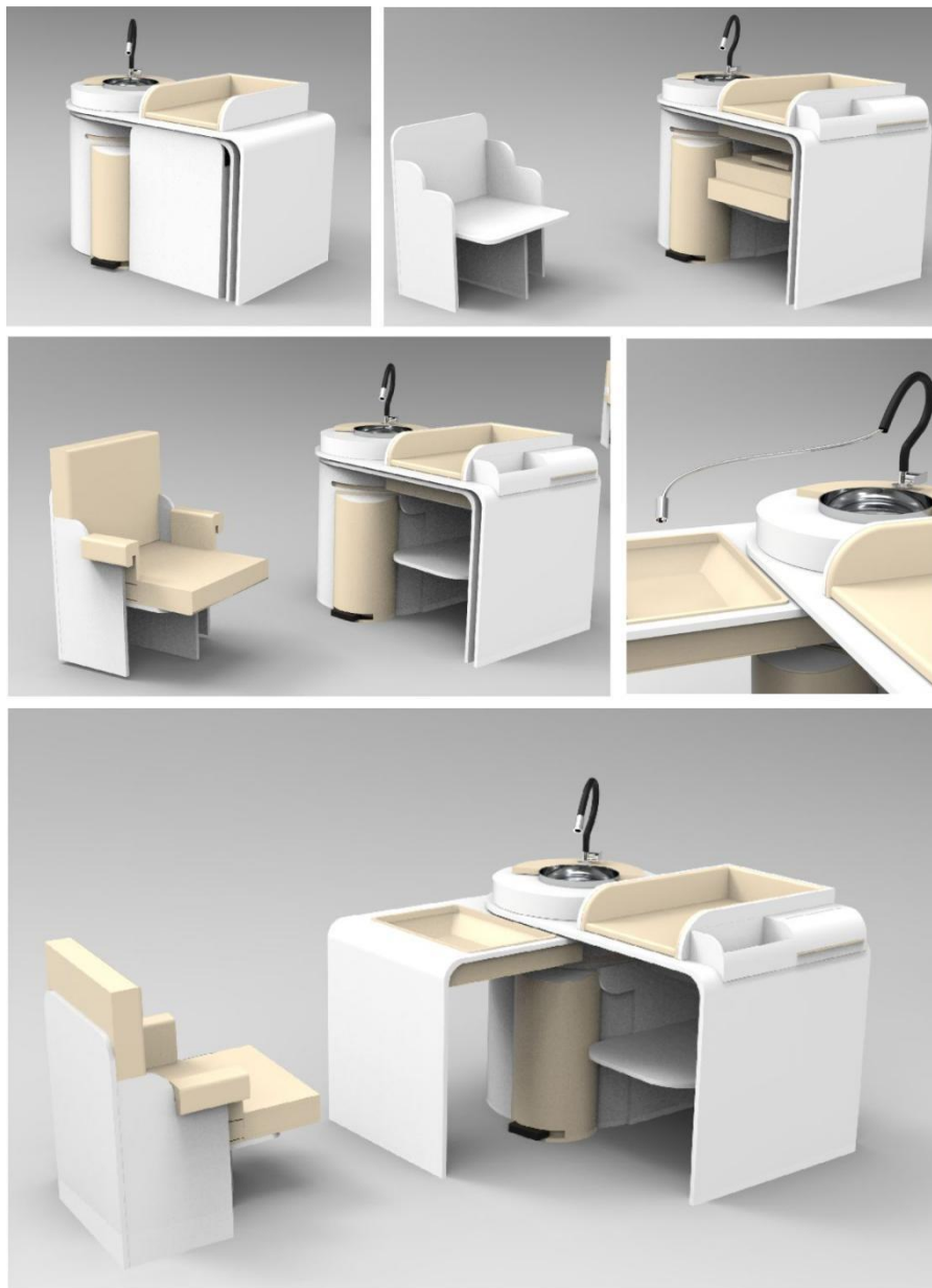
Gambar 3 Desain Final