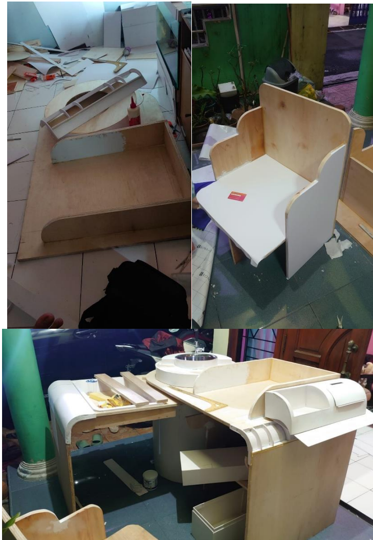
Gambar 3 Mockup