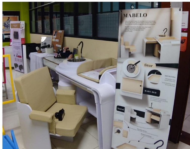
gambar 4 Mockup final