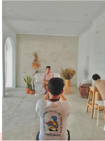
Gambar 10 (Dokumentasi), 2022