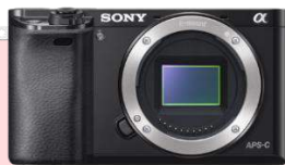
Gambar 4 (Kamera), 2022