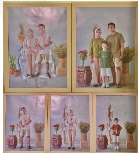
Gambar 14 (Display Karya), 2022