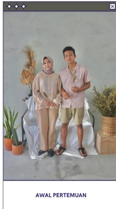
Gambar 11 (Karya 1), 2022

Dalam Kolom Awal Pertemuan yang memakai baju warna cream/coklat susu adalah contoh warna Earth Tone yang pertama. Cerita ini adalah kita sebagai makhluk ciptaan tuhan ditakdirkan untuk berpasangan. Judul Awal Pertemuan ini adalah Ketika 2 sepasang ini bertemu dan menikah yang ditandai oleh bangku berwarna putih, karena warna putih cenderung dipakai Ketika saat ingin menikah, warna putih adalah warna suci, lalu ada daun-daun di belakangnya yaitu sebagai tanda ketenangan bagi pasangan ini karena warna hijau identik dengan warna daun/perkebunan karena membuat kita nyaman dan tenang. dan warna pakaiannya ini ditandakan sebagai awal manusia terbentuk yaitu dari tanah.