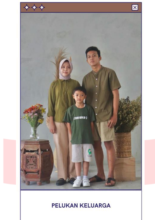
Gambar 12 (Karya 2), 2022