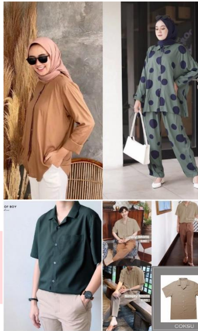
Gambar 7 (Baju Ayah Ibu), 2022