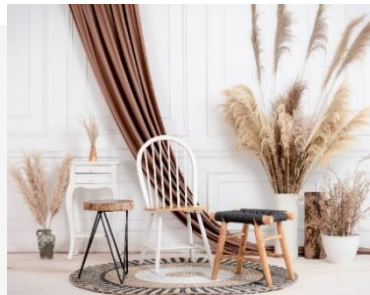
Gambar 5 (Studio), 2022