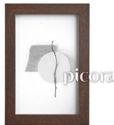
Gambar 8 (Bingkai), 2022