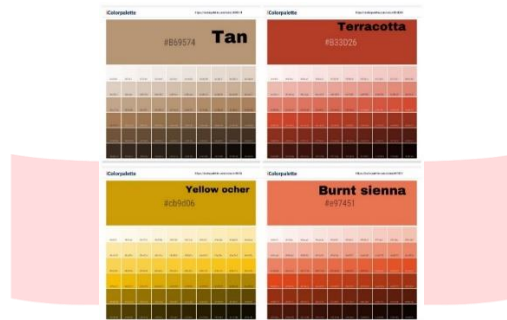
Gambar 1 (Warna Earth Tone 1), 2022