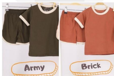
Gambar 6 (Baju Anak), 2022