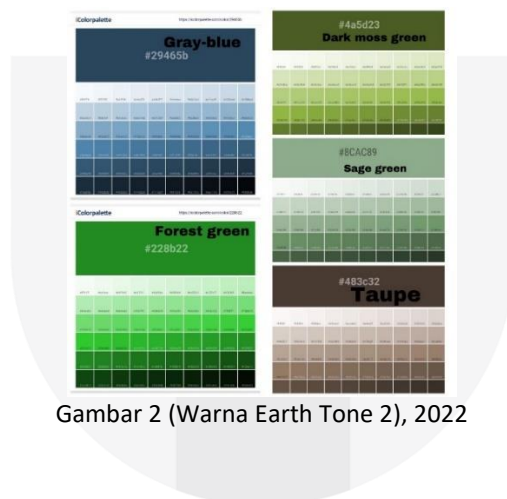
Gambar 2 (Warna Earth Tone 2), 2022