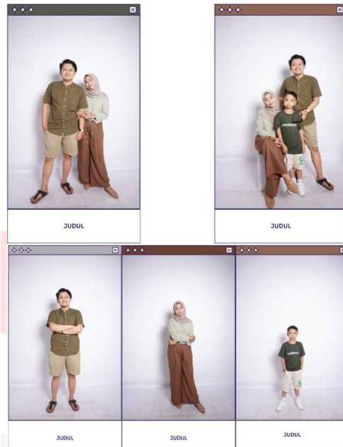
Gambar 9 (Percobaan), 2022