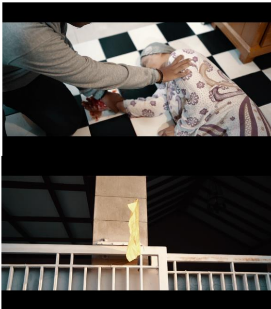
(Gambar 5. Penerapan Cutting pada film “Secercah harapan untuk sang ibu”) Sumber: Hasil olahan penulis, 2022

Cutting dapat disebut sebagai editing yang melakukan proses memilih, mengatur, dan menyusun shot-shot menjadi satu scene . Pada film pendek “Secercah harapan untuk sang ibu” menerapkan salah satu jenis cutting Smash Cut , yaitu berpindahnya gambar secara tiba-tiba dengan tujuan estetika. Berikut adalah contoh penerapan Cutting pada film “Secercah harapan untuk sang ibu” :