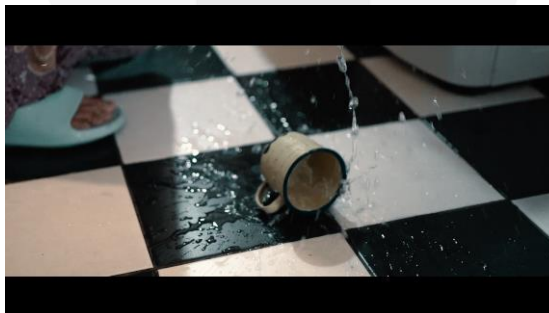
(Gambar 3. Penerapan Close up pada film “Secercah harapan untuk sang ibu”)

Close up digunakan untuk melihat bagian kecil dari setiap kejadian dalam adegan tertentu. Sehingga dapat melihat secara detail bagian yang sangat kecil tersebut. Berikut adalah contoh penerapan Close up pada film “Secercah harapan untuk sang ibu” :