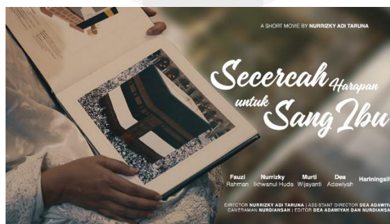
(Gambar 6. Poster Film Pendek “Secercah Harapan untuk Sang Ibu”)

Adapun faktor pendukung lain yang memberikan kesan visual pada film “Secercah Harapan untuk Sang Ibu” menjadi dramatis adalah penataan cahaya, penataan artistik, dan penataan gambar yang baik saat produksi. Selain itu penulis telah membuat poster film pendek “Secercah Harapan untuk Sang Ibu” sebagai media informasi secara garis besar mengenai film tersebut. Adapun poster film pendek “Secercah Harapan untuk Sang Ibu” adalah sebagai berikut :