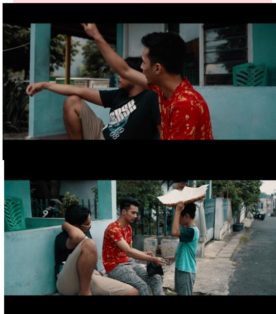
(Gambar 4. Penerapan Continuity pada film “Secercah harapan untuk sang ibu”

Continuity dapat disebut sebagai logika dari sebuah film yang dapat membuat film menjadi realistis dan meyakinkan sehingga membuat penonton bertahan dan hanyut dalam peraturan film dari awal sampai akhir. Continuity dapat terwujud apabila kesinambungan dan logikanya terjaga dengan baik dan diterima secara wajar oleh penonton. Berikut adalah contoh penerapan Continuity pada film “Secercah harapan untuk sang ibu”