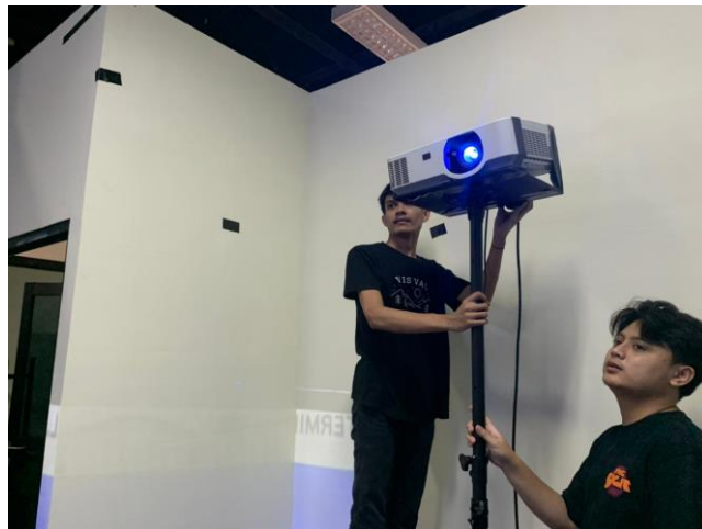
(Gambar 2 Pemasangan Proyektor)

Awal pengerjaan yaitu mempersiapkan ruangan yang sesuai dan setelah mempersiapkan ruangan masuk ke pemasangan projector ditempatkan di ruangan yang telah disediakan untuk pengerjaan instalasi dan ditempatkan sesuai jarak tembak proyektor. Proyektor yang digunakan menggunakan merk NEC dengan 7000Lumens yang sudah cukup untuk menampilkan detail visual.