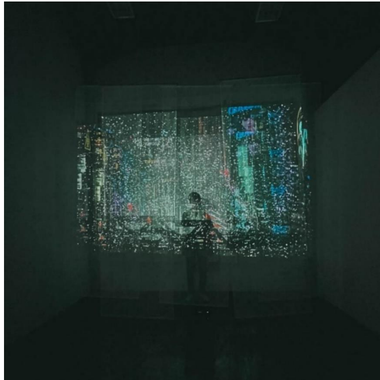
(Gambar 5 Pengerjaan Final)