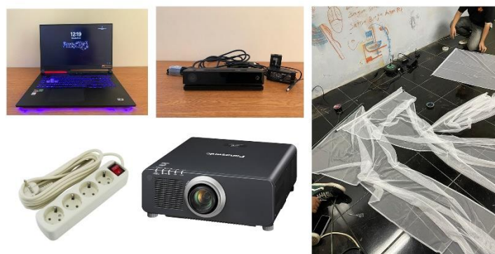
(Gambar 1 Pemasangan Projektor)

Pemilihan medium untuk pembuatan karya seni interaktif menggunakan alat-alat pilihan agar nantinya karya berjalan sesuai yang telah dikonsepskan, medium karya seni interaktif ini menggunakan laptop sebagai inti dari karyanya laptop digunakan dari awal pembuatan sketsa sampai proses penampilan visual, alat pendukung lainnya seperti kinect, kain holoscreen , projector dan alat lainnya.