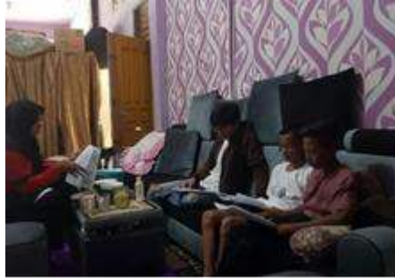
Gambar 7, Proses Produksi Film Pendek Kayuah

Proses editing film pendek “Kayuah” menggunakan software editing Adobe Premier Pro. Dengan durasi 5 menit, menggunakan aspek rasio 2.35:1 dan resolusi 2160p (4K).