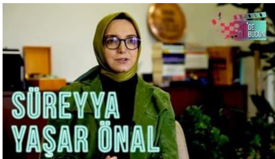
Gambar 1, Sureyya Yassar Onal

Sureyya Yassar Onal adalah Wanita berkebangsaan turki yang berprofesi sebagai penulis, sutradara dan produser film. dalam perjalanan karirnya Sureyya banyak menerima penghargaan dibidang film dokumenter, tidak hanya itu sureyya sering terlibat dalam produksi serial TV dan film layar lebar. Salah filmnya berjudul Son Muhafiz Kudus "Vatan Sinirlarini Haritalar Belirlemez" atau Penjaga Terakhir Yerusalem "Map Tidak Menentukan Batas Dunia" merupakan salah satu film yang diproduseri oleh Sureyya pada tahun 2008, yang di produksi bersama Lion Film dan Base Yapim. Film Son Muhafiz Kudus ini menceritakan tentang tentara turkey yang bertahan hingga akhir menjadi masjid Al-Aqsa dan Tanah Jerussalem, dia mewariskan dan mewasiatkan kepada anak cucunya untuk tetap menjaga kiblat pertama umat islam.