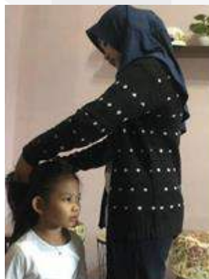
Gambar 6, Proses Produksi Film Pendek Kayuah

Proses produksi di lapangan sering terjadi perubahan dari apa yang direncanakan sebelumnya, maka dari itu sutradara perlu memberikan keputusan yang bijak apabila terjadi sesuatu yang tidak sesuai dengan rencana awal.