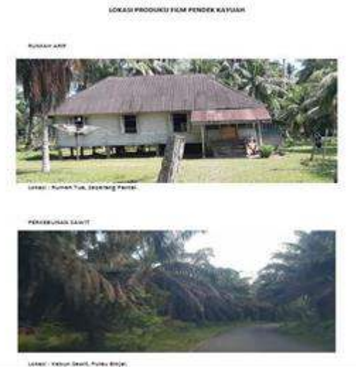
Gambar 5, Lokasi Produksi