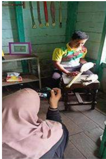
Gambar 8, Proses Produksi Film Pendek Kayuah

Proses editing film pendek “Kayuah” menggunakan software editing Adobe Premier Pro. Dengan durasi 5 menit, menggunakan aspek rasio 2.35:1 dan resolusi 2160p (4K).