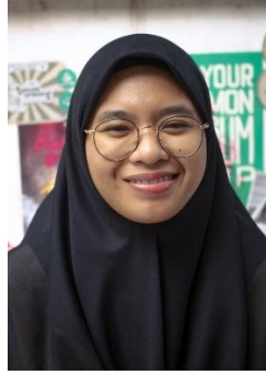
Gambar 19. Ekspresi Bahagia