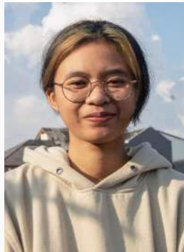
Gambar 4. Ekspresi Bahagia