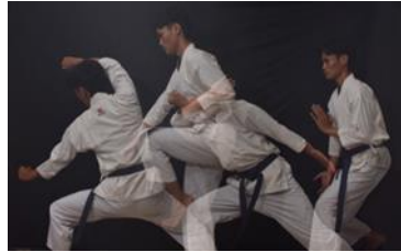
Gambar 7 "Pasang Harimau Menanti"