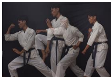
Gambar 8 "Pasang 25"