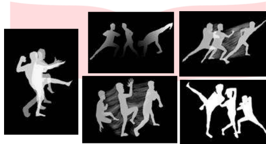
Gambar 4 (Sketsa Karya)

Sketsa karya yang akan dipakai dalam karya ini merupakan beberapa gerakan dasar dalam PSHT, dari sketsa yang dibuat, ada 5 sketsa pilihan komposisi yang didapat. Gerakan dasar ini bisa saja berubah pada karya akhirnya, namun dengan komposisi yang sejenis. Kelima komposisi tersebut bisa digunakan semua atau bisa dipilih beberapa.