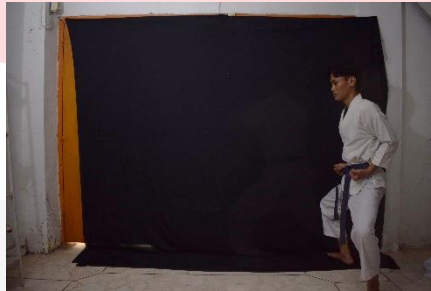
Gambar 1 (Lokasi Studio), 2022

Observasi bisa disebut dengan Pengamatan, pengamatan dalam pengkaryaan ini berkaitan dengan tempat pembuatan karya, tempat latihan seorang pendekar PSHT, dalam pengkaryaan ini penulis menggunakan studio foto sebagai tempat dalam pembuatan karya ini. Ruangan yang digunakan dalam pengkaryaan ini berukuran 3x5m 2 .