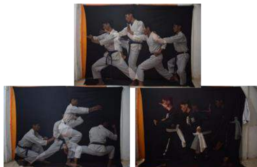
Gambar 5 (Percobaan Kostum Pencak Silat), 2022

Sebelum mengeksekusi karya, penulis mencoba berbagai hal untuk mengathui teknik Stroboscopic Lighting digunakan. Penulis mencoba meletakkan lighting utama dibagian kanan dan kiri objek, dan melakukan kombinasi warna kostum objek yang cocok akan seperti apa dan juga kombinasi gerakan serta ekspresi objek, penulis membuat 3 kali percobaan trial dan error dengan keputusan bahwa kostum yang berwarna putih lebih terlihat jelas objeknya.