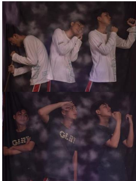
Gambar 3 (Percobaan Teknik Foto Stroboscopic Lighting ), 2022

Perwujudan merupakan sebuah aksi atau eksekusi dalam suatu kegiatan, pada pengkaryaan ini, penulis telah melakukan eksperimen terhadap konsep foto yang dibuat, seperti pada contoh dibawah ini, penulis mencoba Teknik foto Stroboscopic lighting dengan menggunakan rentan waktu atau timer yang berbeda-beda.