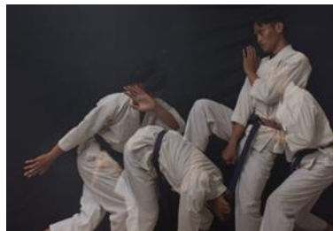
Gambar 9 "Pasang 26 Rendah"