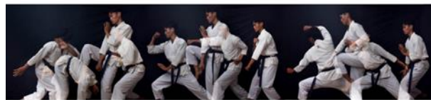
Gambar 10 "Berani, Tegas, Teliti"

Display karya diatas menggunakan konsep RWD (Ruang Waktu Datar) yang konsepnya mirip dengan relief yang ada di candi Borobudur, tujuan dari konsep ini yaitu menelaah makna yang terkandung didalam gerakan tersebut sesuai dengan teori RWD, dengan menggabungkan tiga rangkaian foto menjadi satu sequence yang panjang seperti halnya relief yang berbentuk persegi panjang dan bermakna.