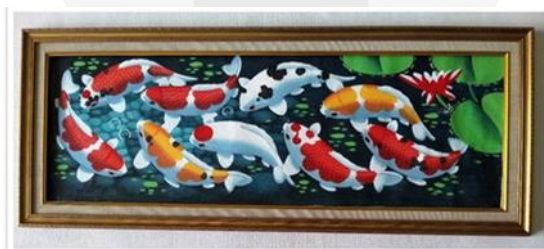
Gambar 6 (Bingkai Foto), 2022

karya dicetak dengan menggunakan kertas glossy dengan dimensi 20 x 30 cm tiap foto dan digabungkan sesuai konsep dari teori RWD (Ruang Waktu Datar) sehingga menjadi ukuran 20 x 90cm, dan diletakkan ke sebuah bingkai berukuran 30 x 90 cm yang berlapis emas, lapis emas ini mempunyai makna kemewahan dan menjadi daya tarik bagi pengunjung yang melihat karyanya, dan bingkai tersebut mempunyai motif mata dewa, sebab dalam agama hindu dewa diartikan sebagai perantara tuhan yang mempunyai keistimewaan tiap dewa nya, ini menandakan bahwa bingkai mata dewa diartikan sebagai sebuah objek yang menjadi pusat perhatian oleh para dewa, yang berarti objek tersebut sangat penting.