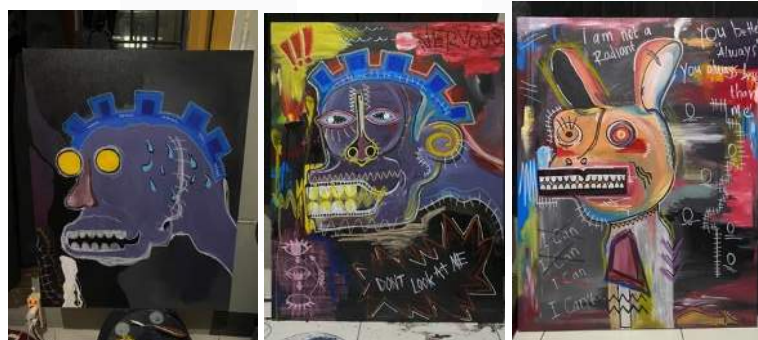
Gambar 8 Trial and Error

Berikut merupakan hasil 3 kanvas yang gagal dikarenakan visual dari konsep yang kurang memuaskan bagi penulis dan juga penggunaan media yang salah