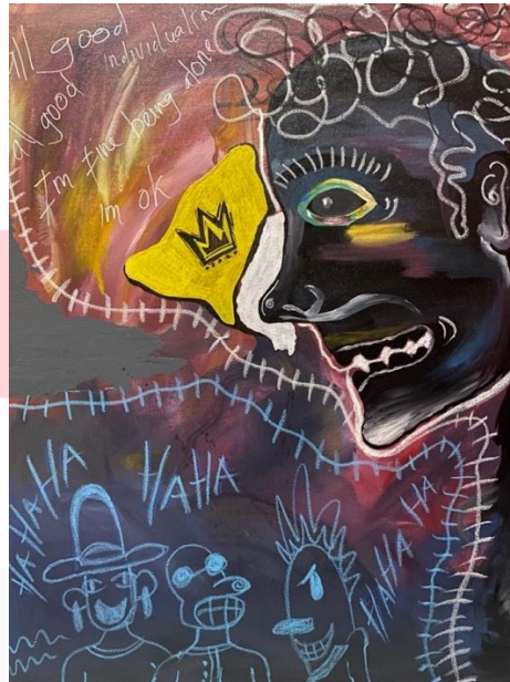
Gambar 9 All Good Mix Media on Canvas 70x90cm

Rasa ketidakpercayaan diri membuat seseorang cenderung menghindari lingkungan karena memiliki anggapan bahwa tidak diterima di lingkungan manapun. Orang yang kurang percaya diri sering kali kesulitan untuk berteman, terkadang segala sesuatunya akan di-lakukan untuk menjauhkan diri dari lingkungan sosial. Bahkan jika seseorang yang mempunyai rasa percaya diri yang rendah ini merasa sendirian, ia merasa semuanya akan berjalan baik-baik saja dan tidak perlu bergaul dengan yang lainnya. Adapun simbol mahkota pada karya ini diibaratkan dengan istana atau zona nyaman baginya, simbol mahkota ini menggambarkan bahwa ia mempunyai istana nya sendiri yaitu menyendiri. Digambarkannya mahkota dihadapan matanya merupakan arti bahwa ia merasa