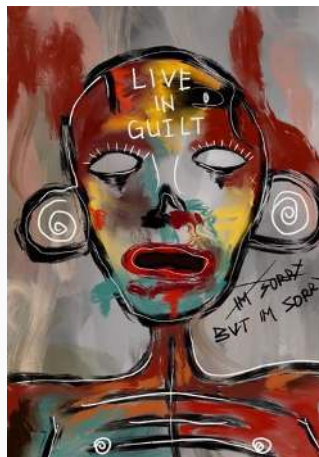
Gambar 6 Sketsa Karya 4, Digital Painting Ukuran A4