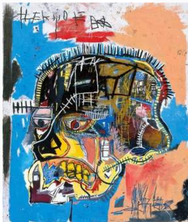
Gambar 2 "Untitled" (Skull), Jean-Michel Basquiat (1981)

Seniman Amerika bernama Jean-Michel Basquiat berasal dari Brooklyn, New York dan lahir pada tanggal 22 Desember 1960. Basquiat merupakan seniman neo-ekspresionis yang sering memadukan seni abstrak dan kiasan yang kabur, dan juga menciptakan karya seni yang memiliki pesan di baliknya serta kritik terhadap kontemporer. Karya-karya Basquiat sangat menarik perhatian publik, karena karya yang dibuat oleh Basquiat mengangkat isu-isu seperti dunia batin vs. pengalaman eksternal dan kekayaan vs. kemiskinan. Bahkan ia cenderung menggambar sosok kulit hitam yang berperan penting dalam sejarah, dan sering ditonjolkan dengan mahkota di atas kepala atau lingkaran cahaya. Selain itu, Basquiat juga kerap mengangkat isu rasisme, perbudakan hingga kehidupan di New York pada masa itu.