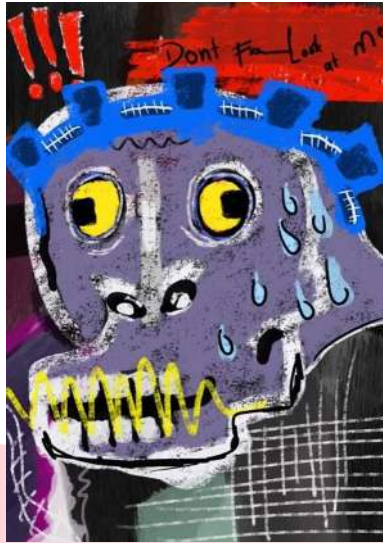
Gambar 5 Sketsa Karya 3, Digital Painting Ukuran A4