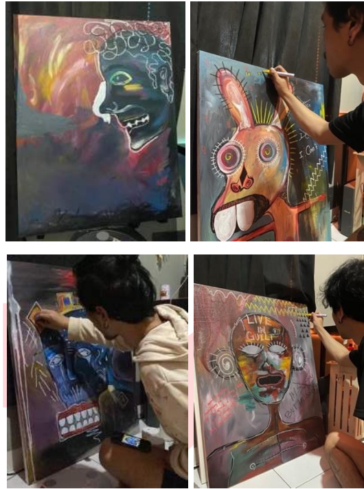
Gambar 7 Proses Pengerjaan Kanvas (All Good, You Better, Don't Look At Me dan I'm Sorry but I'm Sorry)