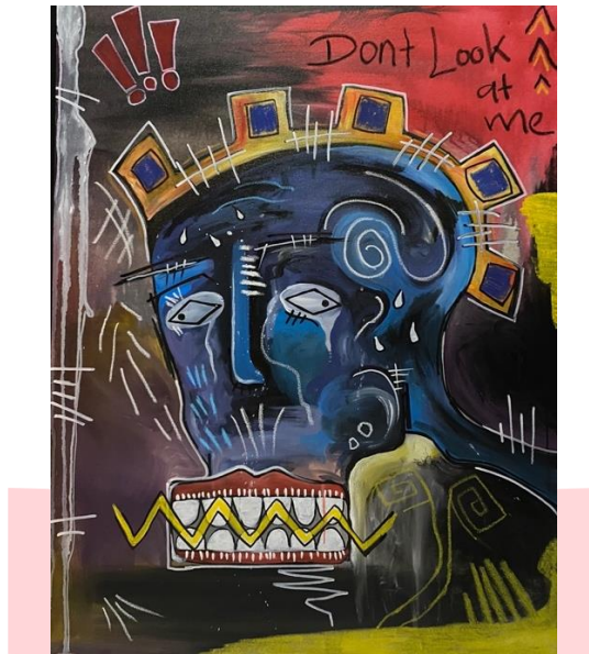
Gambar 11 Don't Look At Me Mix Media on Canvas 70x90cm

Mempunyai rasa ketidakpercayaan diri membuat seseorang dapat merasa tidak terlalu nyaman melakukan kontak mata dengan publik maupun dengan lawan bicaranya sendiri. Terkadang seseorang yang mempunyai rasa ketidakpercayaan diri ini tidak suka jika orang-orang atau publik melihatnya atau biasa disebut tidak suka menjadi pusat perhatian, karena selalu merasa ada sesuatu yang kurang pada dirinya atau merasa ada yang berbeda dari dirinya termasuk cara berpenampilan. Pada karya ini terdapat simbol tanda seru yang menggambarkan bahwa ia memiliki tingkat kewaspadaan yang tinggi terhadap orang yang ingin mengenal ia lebih dekat karena ia merasa cemas akan dihakimi dengan segala kekurangannya. Mulut dan mata pada karya ini mempunyai artian sebagai rasa gugup, tidak mempunyai ketegasan. Bentuk mulut ini merupakan bentuk mulut tidak vocal atau terbata-bata dalam bicara. Isu ketidakpercayaan diri pada karya ini digambarkan dengan beberapa simbol yang menciptakan rasa ketegangan. Rasa ketegangan pada isu ini berartikan bahwa ia tidak suka menjadi