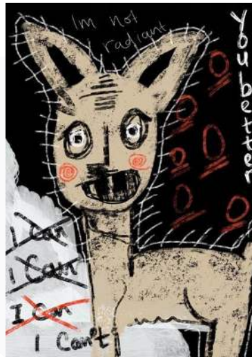
Gambar 4 Sketsa Karya 2, Digital Painting Ukuran A4