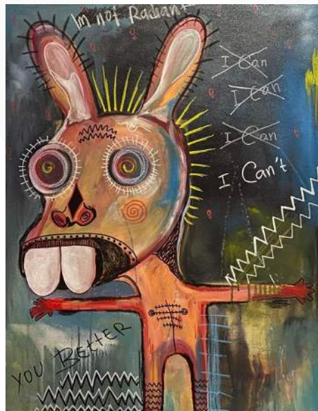
Gambar 10 You Better Mix Media on Canvas 70x90cm