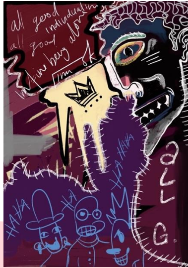
Gambar 3 Sketsa Karya 1, Digital Painting Ukuran A4