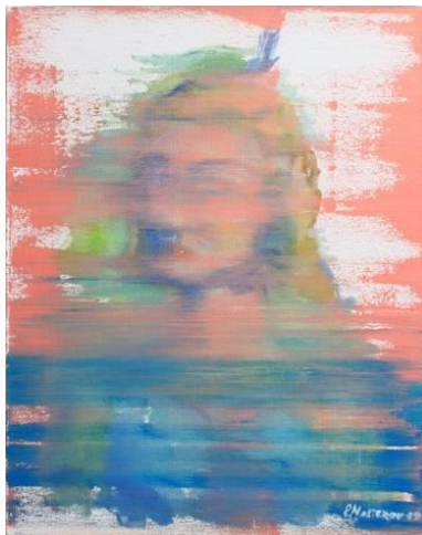
Gambar 1 Self Doubt , Evgeniy Nesterov (2019)

Nesterov memiliki subyek inspirasi seperti sifat manusia, pengalaman batin dan perasaan. Evgeniy Nesterov lahir di kota Chelyabinsk, Rusia pada tahun 1990, ia mengungkapkan bahwa tujuan berkarya seni ini sebagai media penyampaian pesan tentang bagaimana manusia memperlihatkan sifat hingga perasaannya. Dalam karya Nesterov yang berjudul " Self Doubt " yang dibuat pada tahun 2019 ini mengangkat isu ketidakpercayaan diri, menyentuh dunia batin wanita, dengan yang pertama, keraguan mereka tentang feminitas dan kecantikan.