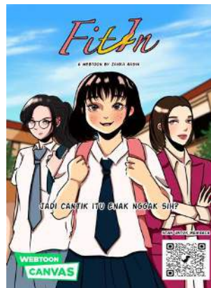
Gambar 4.5 Contoh Poster