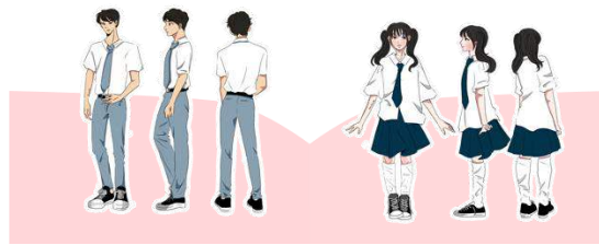
Gambar 4.4 Desain Karakte