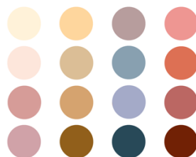
Gambar 4.1 Palet Warna

Warna yang akan digunakan pada perancangan Webtoon ini merupakan warna-warna pastel. Menurut Marvel, Waluyanto, dkk (2018) warna pastel merupakan campuran warna dasar dengan warna putih sehingga menghasilkan warna-warna lembut, yang berdasarkan prinsip psikologi warna dapat menciptakan suasana santai dan nyaman untuk pembaca.