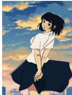
Gambar 4.3 Ilustrasi cerita bergambar (Sumber : dokumentasi pribadi)

Gaya ilustrasi dari komik menggunakan cerita bergambar dengan penggunaan media digital painting . Cerita bergambar biasa digunakan untuk komik, dengan ilustrasi semi-realis. Pengayaan dipilih sesuai dengan hasil data kuesioner yang paling banyak dipilih oleh responden.