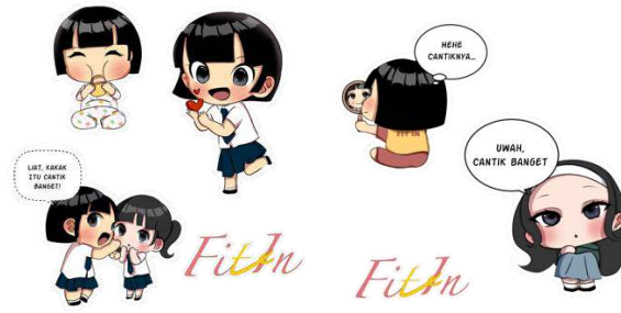
Gambar 4.7 Mockup Notebook