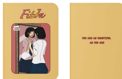
Gambar 4.6 Mockup Notebook