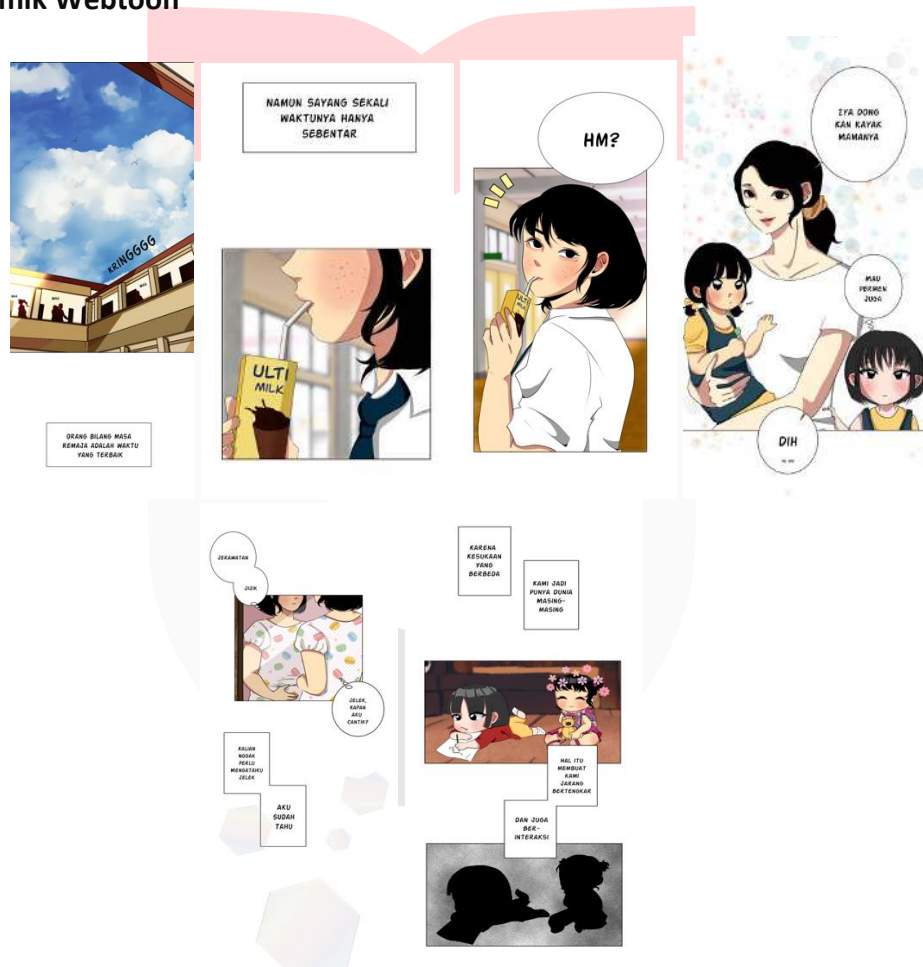
Gambar 4.6 Mockup Notebook