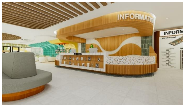
Gambar 4 Penerapan Aspek Complying (banyak permintaan)