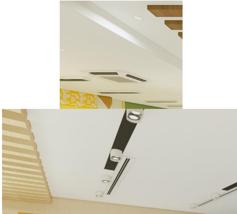
Gambar 11 Penerapan Aspek Comforting (Penghawaan)