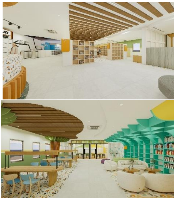
Gambar 8 Penerapan Aspek Comforting (Warna)

Warna-warna ini dikombinasikan dengan warna netral yang membantu mengurangi ketegangan visual dan meningkatkan kenyamanan dan menciptakan ruang yang mendukung dan kesejahteraan mental.