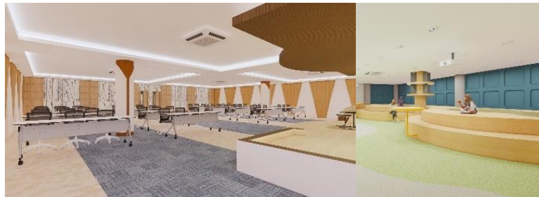
Gambar 10 Penerapan Aspek Comforting (Akustik)