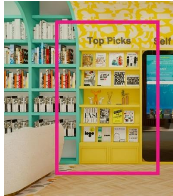
Gambar 5 Penerapan Aspek Complying (peragu)