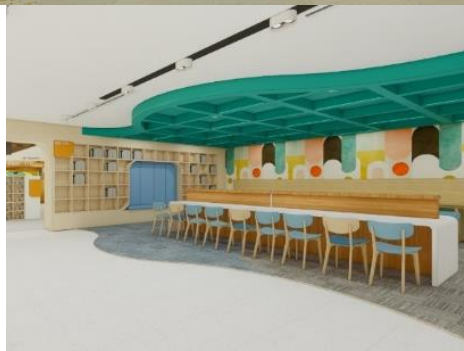
Gambar 6 Penerapan Aspek Communicating