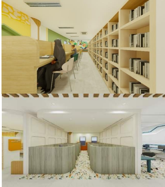
Gambar 2 Penerapan Aspek Complying