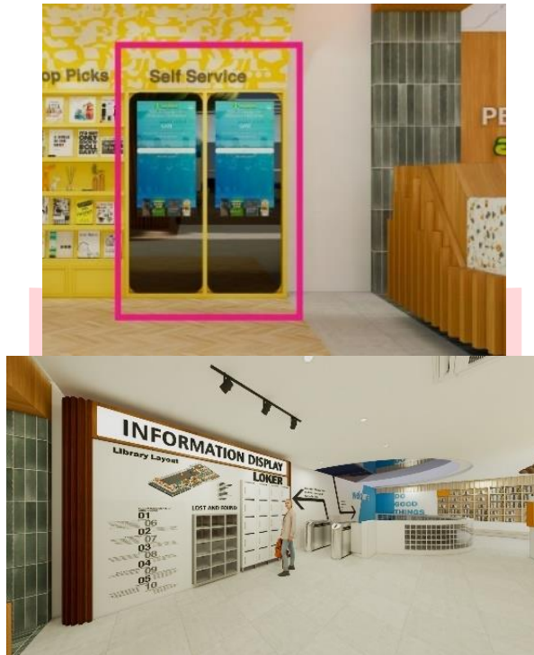
Gambar 7 Penerapan Aspek Communicating

Selain itu, fasilitas display digital dan sistem wayfinding di perpustakaan dapat meningkatkan interaksi antara pengguna dan ruang perputakaan.