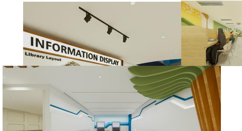
Gambar 9 Penerapan Aspek Comforting (Pencahayaian)