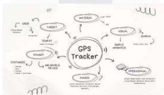
Gambar 2 Mind mapping perancangan gps tracker Sumber: data penulis

Berdasarkan hasil dari pemahaman, kebutuhan, dan pertimbangan serta batasan yang ada maka didapatkan mind map seperti gambar dibawah ini.