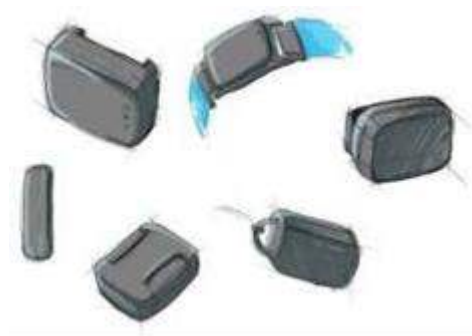
Gambar 4 Sketsa terpilih

Pembuatan prototype dari sketsa terpilih menggunakan 3d printer dengan filament PLA+ dan ABS. Setelah prototype selesai maka dilakukan uji validasi dengan menguji-cobakan prototype kepada orang dengan demensia alzheimer dan prototype dioperasikan oleh caregiversnya selama 1 hari. Berikut adalah hasil dari ujicoba prototype produk tersebut :