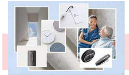
Gambar 2 Moodboard

merasa terganggu dengan berat produk. Produk dapat di- customize menjadi berbagai wearable device seperti baju, kalung, gelang dan juga ikat pinggang. Hal ini berguna untuk menyesuaikan kegiatan dan kebiasaan dari orang dengan demensia alzheimer. Lalu kesan, estetika, atau suasana yang ingin disampaikan pada produk ini adalah ketenangan dan kesederhanaan.