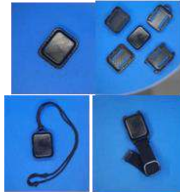
Gambar 5 Hasil akhir prototype