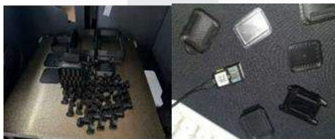
Gambar 5 Proses pembuatan prototype