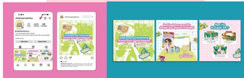
Gambar 8 Media Sosial