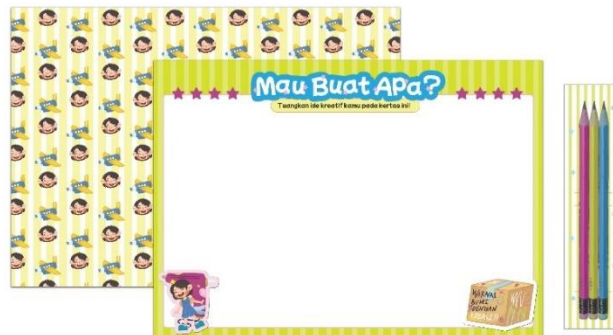
Gambar 9 Kertas Aktivitas & Pensil Warna Sumber: Defa Irawati, Juli 2024