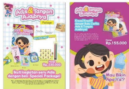
Gambar 7 Poster A3