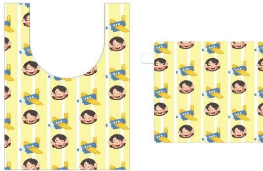
Gambar 13 Shopping Bag Sumber: Defa Irawati, Juli 2024