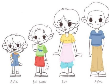
Gambar 2 Sketsa Karakter