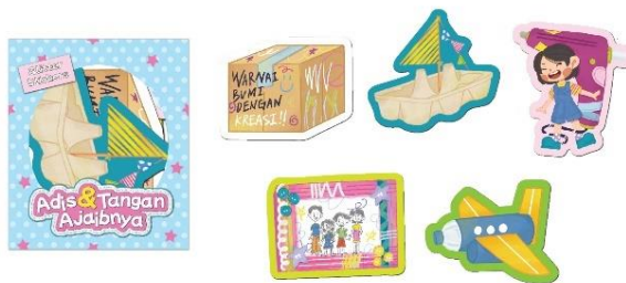
Gambar 12 Stiker