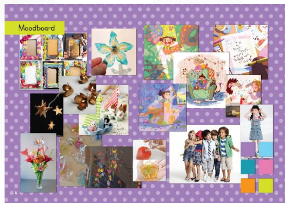
Gambar.1 Moodboard

Moodboard untuk membantu perancangan buku ilustrasi. Moodboard digunakan sebagai referensi visual untuk mempermudah perancangan buku.