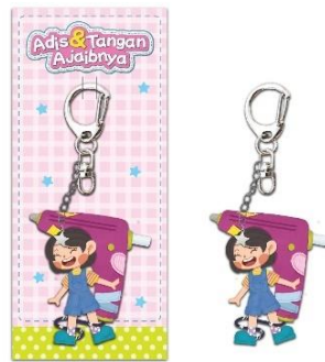
Gambar 10 Gantungan Kunci