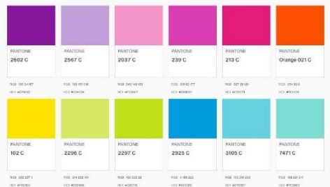
Gambar 3 Color Palette

Warna yang digunakan lebih ekspresif dan diambil dari kata kreatif serta kreasi sehingga warna-warna yang diberikan terkesan lebih cerah dan banyak warna.