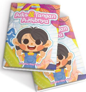
Gambar 6 Mockup Buku Ilustrasi