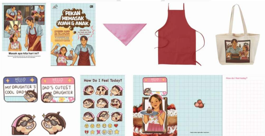
Gambar 4. Media Pendukung

Layout buku dirancang dengan pola membaca "Z", sesuai dengan kebiasaan membaca masyarakat Indonesia yang menggunakan huruf latin. Ilustrasi mendominasi halaman, sementara teks digunakan sebagai penjelas ilustrasi, memastikan informasi disampaikan secara efektif dan menarik. Ilustrasi dalam buku ini banyak menggambarkan momen interaksi antara ayah dan anak, dengan tujuan menimbulkan dorongan emosional pada audiens. Ilustrasi dibuat dalam format landscape, mencakup gambar interaksi serta bahan dan langkah memasak untuk memudahkan ayah dan anak mengikuti instruksi.