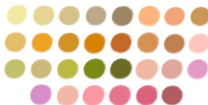
Gambar 1 Color Palette yang akan digunakan