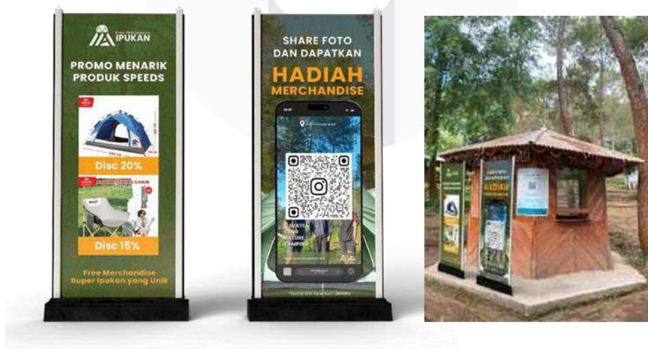
Gambar 7 Rollbanner

Rollbanner ditempatkan di lokasi strategis, mendorong tindakan langsung seperti pemesanan dan reservasi melalui penawaran spesial dan diskon. Digunakan selama seluruh durasi kampanye dari September hingga Oktober. Rollbaner ditempatkan di loket pemesanan tenda Bumi Perkemahan Ipuhan.