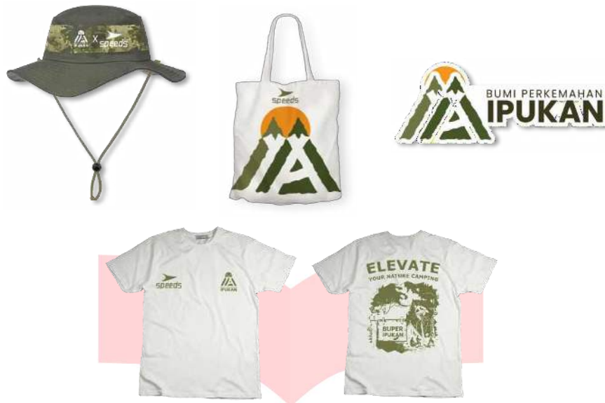
Gambar 10 Merchandise