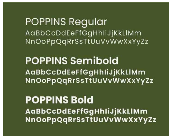
Gambar 4 Tipografi Sans Serif (Poppins)