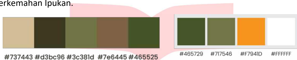
Gambar 3 Warna

Warna dasar yang akan digunakan untuk desain media cetak dan digital adalah warna hijau untuk alam, orange untuk kehangatan, dan putih untuk elemen alami, menciptakan kesan visual yang selaras dengan identitas Bumi Perkemahan Ipukan.