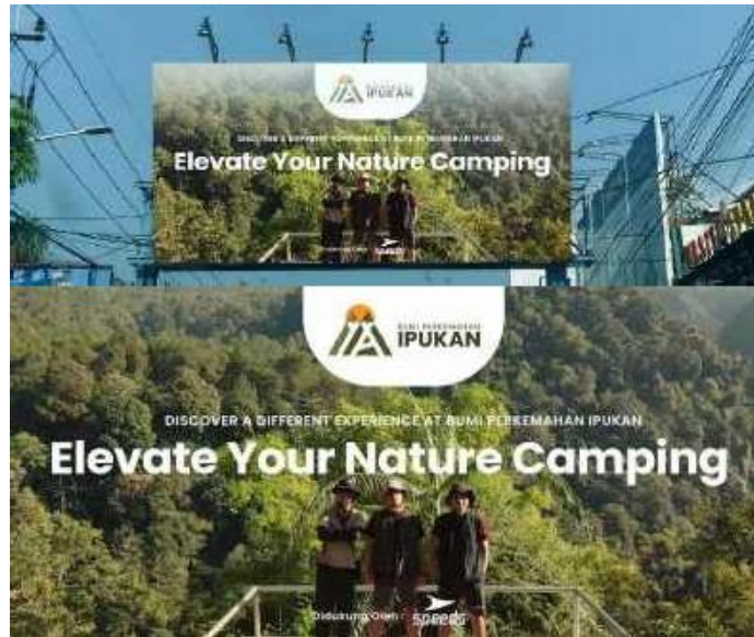
Gambar 6 Billboard

Rollbanner ditempatkan di lokasi strategis, mendorong tindakan langsung seperti pemesanan dan reservasi melalui penawaran spesial dan diskon. Digunakan selama seluruh durasi kampanye dari September hingga Oktober. Rollbaner ditempatkan di loket pemesanan tenda Bumi Perkemahan Ipuhan.