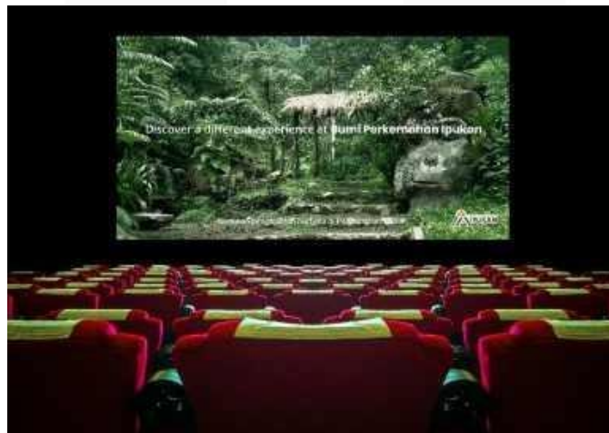
Gambar 5 Bioskop

Di bioskop, iklan memperkenalkan pengalaman Bumi Perkemahan Ipukan kepada audiens yang lebih luas dengan konten visual yang memikat. Iklan TVC ini akan dilakukan submission ke CGV Grage City mall dan Diputar selama bulan September hingga awal Oktober untuk memanfaatkan musim liburan.