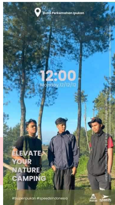
Gambar 9 Filter Instagram

Merchandise dimanfaatkan untuk mendorong pengguna membagikan pengalaman mereka di media sosial, sehingga meningkatkan brand awareness. Setiap pengunjung yang telah melakukan reservasi akan mendapatkan stiker Bumi Perkemahan Ipuhan secara gratis. Selain itu, pengunjung yang membeli produk dari Speeds akan menerima merchandise berupa kaos dan totebag dengan tema Bumi Perkemahan Ipuhan dan Speeds. Sebagai tambahan, topi camping akan diberikan secara gratis kepada pengunjung yang membagikan foto atau video menggunakan Filter Instagram ke akun Instagram mereka dengan tagar #buperipukan #speedsindonesia. Merchandise ini mulai diperkenalkan pada pertengahan September dan tersedia sepanjang periode kampanye.