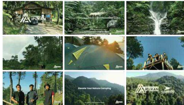
Gambar 1 Cuplikan Iklan TVC