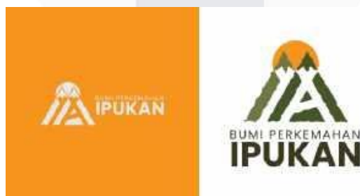
Gambar 2 Logo Sumber : Hidayatullah (2024)

Untuk eksekusi yang akan dilakukan pada TVC Di Bumi Perkemahan Ipuhan, Kosep visual menampilkan keindahan alam yang memukau dengan gaya sinematic dan voiceover bergaya dramatic. Penggunaan tokoh sekelompok remaja pria yang sedang liburan. Menampilkan matahari terbit dan pemandangan Gunung Ciremai. Hutan pinus yang rindang memberikan kesejukan dan kedamaian, sementara suara gemericik air dari curug-curug terdekat membawa ketenangan yang mendalam. Iklan TVC ini disebarluaskan melalui Instagram Reels, TikTok, YouTube, videotron, dan bioskop. Diluncurkan pada minggu pertama dan kedua bulan September, dengan fokus pada menampilkan keindahan alam, aktivitas piknik dan menciptakan narasi yang memikat