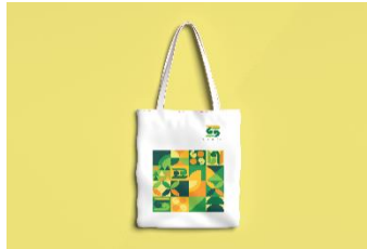
Gambar 21 Totebag