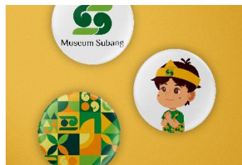
Gambar 17 Pin dan Keyring