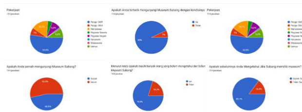
Gambar 1 Tampilan Kuisisioner Google Form

Berdasarkan hasil kuesioner didapatkan total 115 responden yang berasal dari Subang, Jawa Barat, 61 orang dari data merupakan pelajar SMP. Dari data kuesioner diatas dapat disimpulkan bahwa, seluruh responden yang mengisi kuesioner menyatakan mengetahui keberadaan Museum Subang, namun 53% dari responden belum pernah mengunjungi museum. 93% responden menyatakan tertarik untuk mengunjungi Museum Subang. Responden yang berkunjung ke Museum Subang menyatakan setuju bahwa fasilitas yang ada di Museum Subang sudah bagus, namun mereka juga menyatakan netral bahwa media promosi Museum Subang belum efektif dan perlu diberikan perhatian lebih untuk ditingkatkan. Media cetak, media sosial, website/media online menurut responden merupakan media yang efektif untuk dijadikan media promosi. sedangkan souvenir, responden memilih netral sebagai media promosi yang efektif. Media sosial yang sering digunakan oleh responden adalah Instagram dan Tiktok.