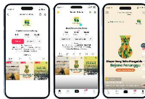
Gambar 13 Tiktok