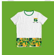
Gambar 19 T-shirt