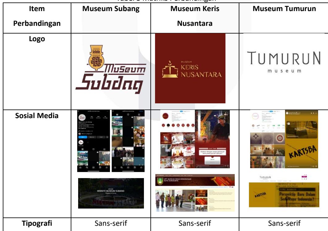
Tabel 3 Matriks Perbandingan