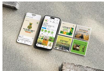
Gambar 12 Instagram