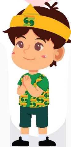
Gambar 9 Maskot