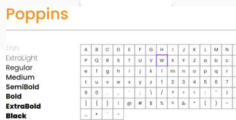
Gambar 7 Font

Tipografi yang akan digunakan adalah jenis Font Sans-Serif karena tampilannya yang bersih dan modern, cocok dengan estetika geometris. Pemilihan font sans serif juga memiliki kejelasan visual karena tidak memiliki detail yang berlebihan font ini tidak akan bertabrakan (seimbang) dengan elemen geometris dalam desain dan menonjolkan bentuk-bentuk dari elemen geometris yang ada. Penggunaan tipografi yang besar dan jelas dalam desain geometri dapat membantu menyampaikan informasi dengan cepat dan efektif, menarik perhatian remaja yang sering kali lebih suka membaca teks yang singkat dan padat.