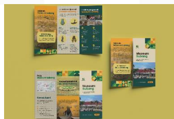
Gambar 14 Brosur