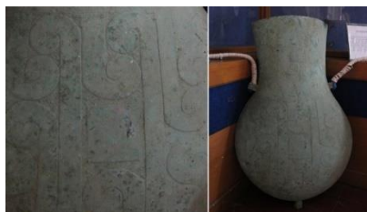
Gambar 3 Bejana Perunggu