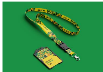
Gambar 18 Lanyard