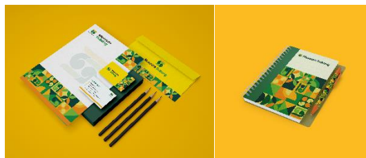
Gambar 20 Stationary