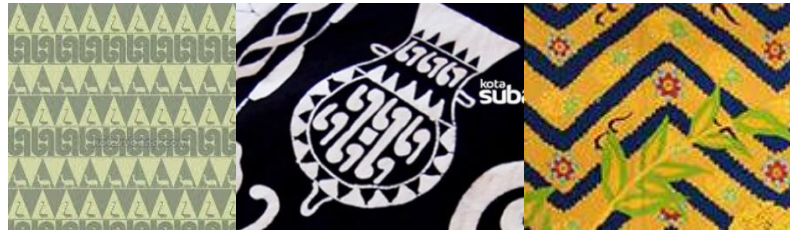
Gambar 4 Motif Batik Subang (Batik Ganasan)