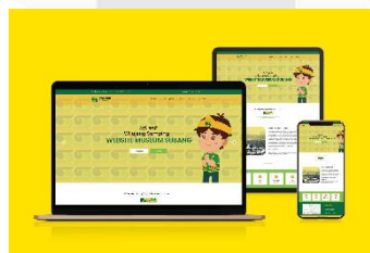
Gambar 10 Website