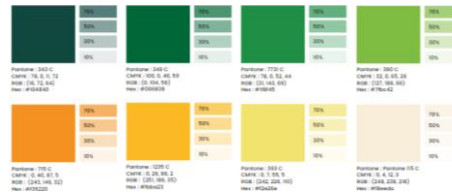
Gambar 6 Color Palet

warna netral seperti putih, krem, dan hitam untuk menjaga kesederhanaan. Selain itu digunakan warna yang berani seperti kuning, hijau, dan orange sebagai kontras dan penarik perhatian dari desain media promosi.