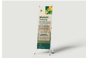
Gambar 16 X-banner