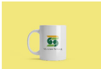
Gambar 22 Mug