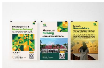
Gambar 15 Poster