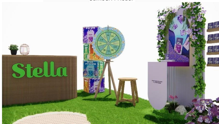
Gambar 1.12 Spinning the Wheels