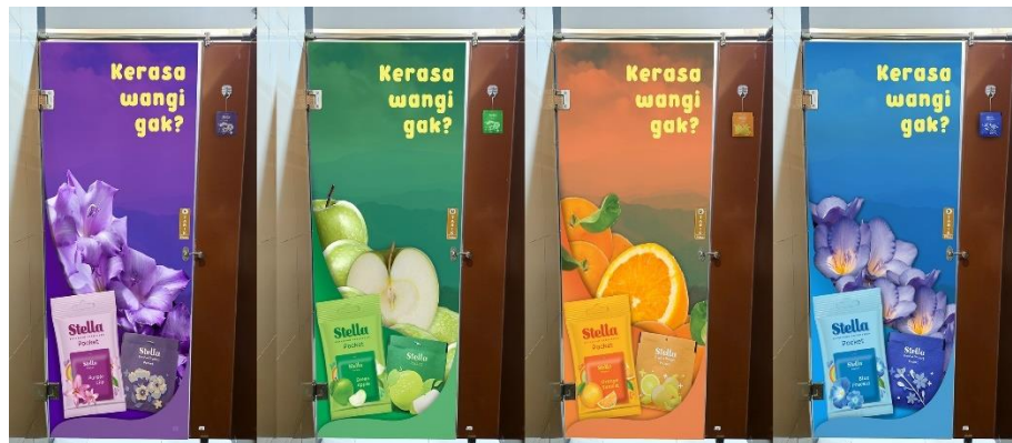
Gambar 1.5 Media ambien di toilet

Dalam media ambien ini juga sudah disediakan stella pocket sehingga target audiens dapat merasakan Stella Pocket dengan aromanya yang menyesuaikan visualisasi dari desainnya.