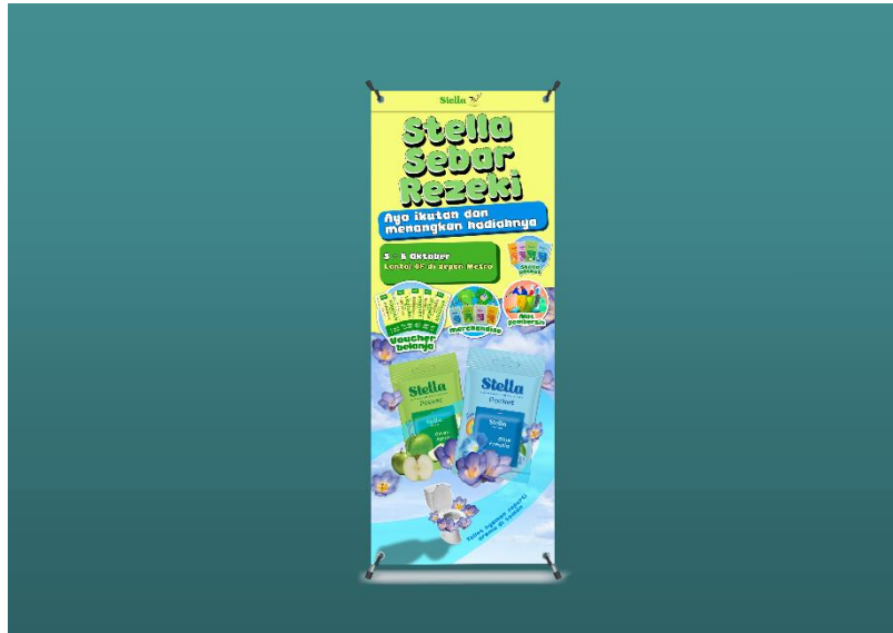
Gambar 1.9 Mock up x banner

disediakan oleh Trans Studio Mall Bandung. Dalam X banner ini akan menyampaikan informasi mengenai event Stella Pocket yang akan diadakan.