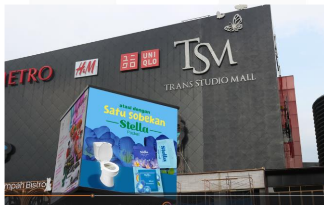
Gambar 1.6 Mock up Videotron

Videotron ini memiliki pesan yang ingin disampaikan bahwa mengatasi toilet yang bau dapat dengan sekejap diatasi oleh Stella Pocket.