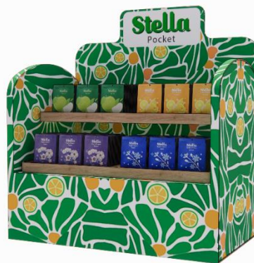
Gambar 1.8 Mock up peletakkan produk

Media Product placement dan flag banner akan diletakkan di minimarket dan supermarket bertujuan untuk lebih membuat target audiens tertarik untuk membeli atau agar mereka lebih menyadari produk Stella Pocket.