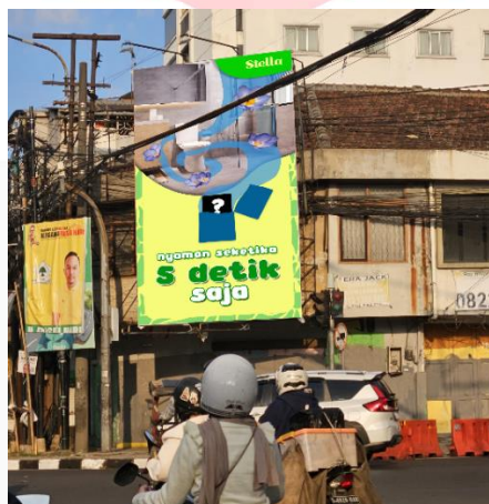
Gambar 1.2 Desain billboard 2

Dalam billboard ini memiliki pesan yang ingin disampaikan yaitu bahwa terdapat produk yang dapat membuat toilet mu menjadi harum dengan mudah sehingga toiletmu menjadi lebih nyaman. Desain billboardnya juga dibuat 2 untuk menyesuaikan bentuk billboard secara landscape dan potrait , namun 2 jenis billboard ini memiliki pesan yang sama. Peletakkan billboard ini pun di letakkan di sekitar daerah Trans Studio Mall, di dekat mall Paskal, di jalan raya buah batu.