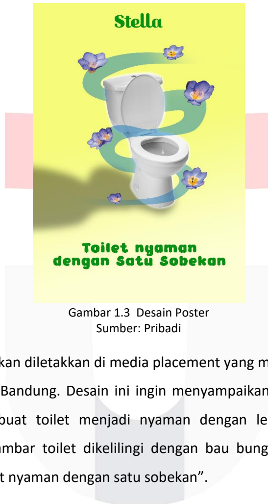
Gambar 1.3 Desain Poster

Poster ini akan diletakkan di media placement yang memang sudah ada di Trans Studio Mall Bandung. Desain ini ingin menyampaikan bahwa ada produk yang dapat membuat toilet menjadi nyaman dengan lebih mudah dengan mencantumkan gambar toilet dikelilingi dengan bau bunga dan ditambahkan tagline yaitu "Toilet nyaman dengan satu sobekan".