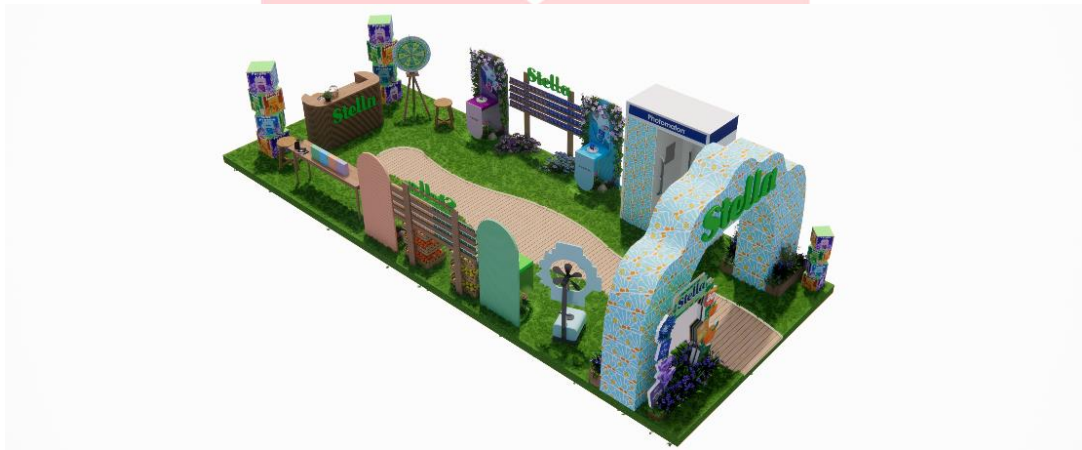
Gambar 1.11 Event tampak Atas