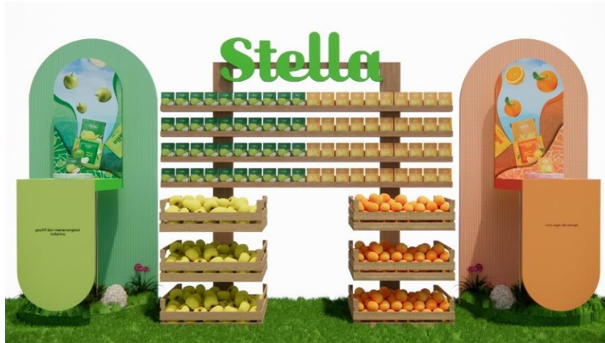
Gambar 1.13 Product experience 1