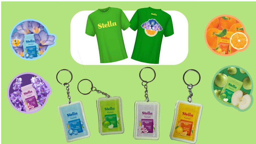
Gambar 1.16 Desain baju merchandise

Dalam proses share ini juga diharapkan target audiens dapat melakukan beberapa dokumentasi berbentuk foto atau video mengenai event ini, ditambah lagi di event ini sudah disediakan beberapa tempat yang sangat cocok untuk mengambil dokumentasi mengenai event ini. Instagram @stella.freshner juga akan mendokumentasikan acara tersebut dan akan mem-posting ulang postingan yang menyebut akun Instagram mereka dalam tujuan untuk terlihat lebih aktif dan terjadinya interaksi antara target audiens dan Stella secara tidak langsung.