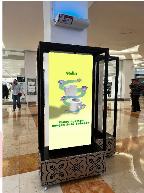
Gambar 1.4 Mock up poster