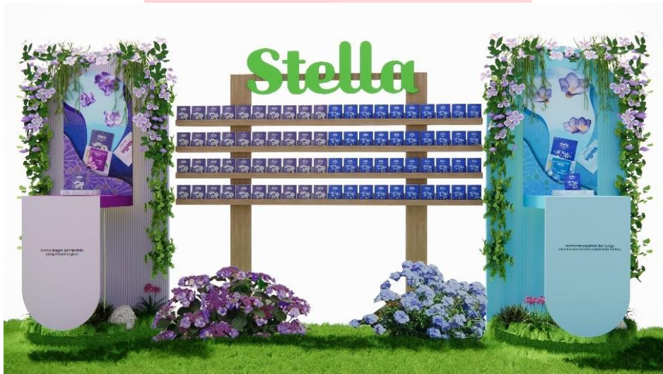
Gambar 1.14 Product Experience 2