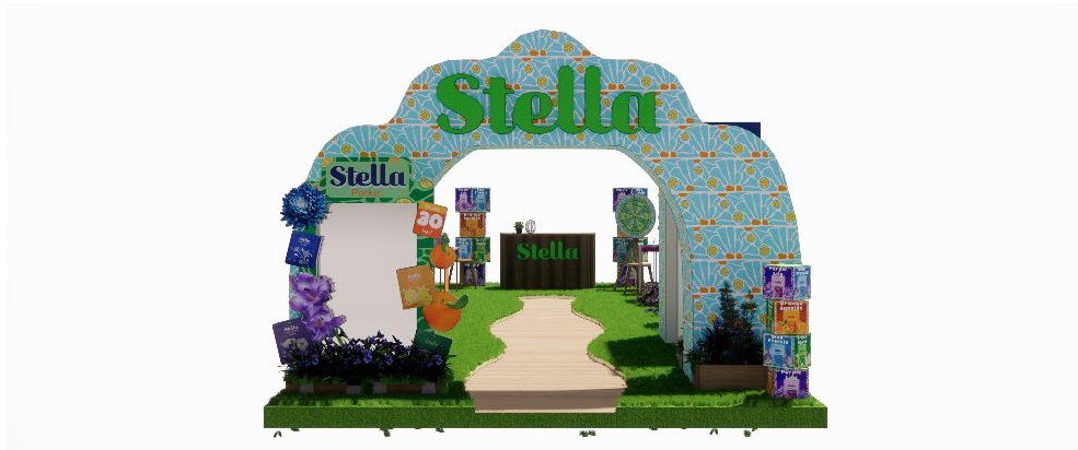
Gambar 1.10 Event tampak depan