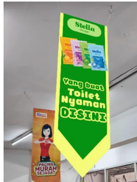
Gambar 1.7 Mockup Flag Banner