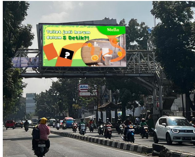
Gambar 1.1 Desain billboard 1