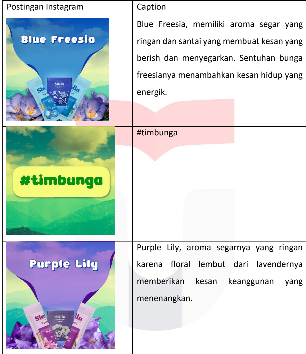
Table 1.2 Instagram feeds @stella.freshner